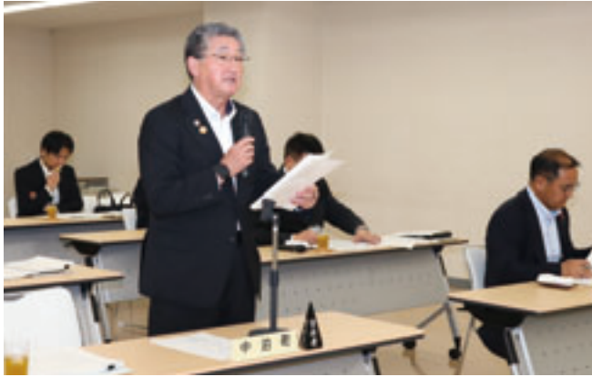
提案理由を説明する演館管理者

議案 ○議案第1号 令和6年度青森県市町村総合事務組合一般会計歳入歳出決算の認定を求めるの件 Ⅱ歳入総額7億6790万2千余円に 対して歳出総額7億5021万9千余円で、