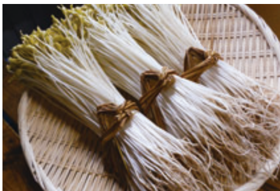
問い合わせ先 大鰐町役場 企画観光課 TEL 0172-55-6561

大鰐温泉もやしは、大鰐町に古くから伝わる伝統の冬野菜です。栽培の秘訣は、温泉の熱だけで地温を高める土耕栽培で、栽培から仕上げに至るまで温泉水のみを使用します。その生産方法は決して口外されることなく受け継がれてきました。そんな大鰐温泉もやしは、独特の芳香とシャキシャキとした歯触り、味の良さ、品質の高さで多くの人に好まれる大鰐町自慢の味わいです。大鰐町地域交流センター「鰐come」又は福士食料品店でご購入いただけます。