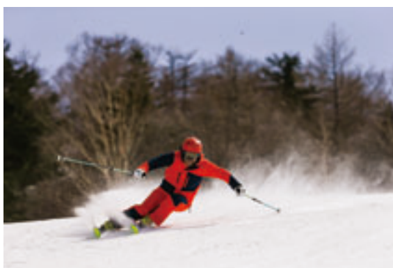
問い合わせ先 青森スプリング・スキーリゾート TEL 0173-72-1011

鱒ヶ沢町の山あい広がる「青森スプリング・スキーリゾート」は、豊富な雪と広大な日本海を望む特別な場所です。上質なパウダースノーと多彩なコースが魅力で、スキーやスノーボードを存分に楽しめます。雄大な海景を望む絶景のなか、心躍る冬のひとときをお過ごしください。