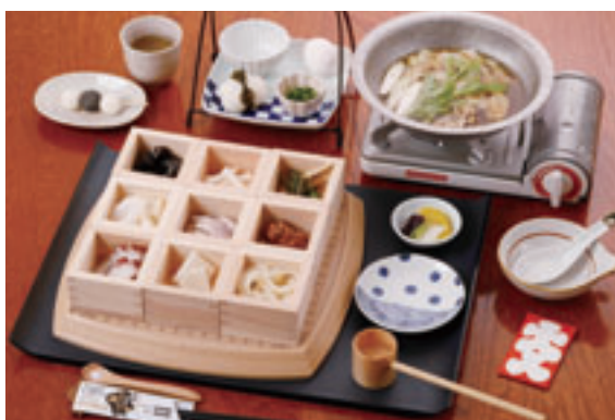
問い合わせ先 中泊町役場 水産商工観光課 TEL 0173-57-2111

町の新ご当地グルメ第2弾「中泊メバルちゃんこ鍋」は、相撲のマス席をイメージした9種類の具材が特徴の寒い冬には堪らない鍋料理です。（3月末まで提供）