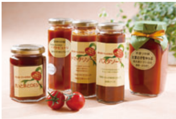
問い合わせ先 物産館マルシェよもぎた TEL 0174-31-3040

トマトがおいしい蓬田村。生のトマトはもちろんですが、加工品もかなりオススメです。