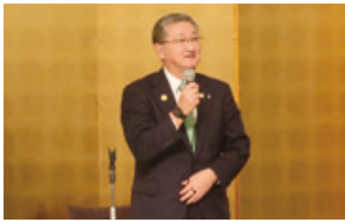
開会あいさつする演館会長

本会は11月18日、東京都のホテルニューオータニで令和7年第2回臨時総会を開催した。出席者は演館会長はじめ町村長27人。 臨時総会では、演館会長のあいさつに続き議事に入り、本会一般会計の補正予算案について審議し、原案どおり議決した。 また、臨時総会終了後に引き続き、町村長大会説明会及び県選出国会議員との懇談会を開催した。