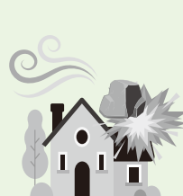
建物外部からの 物体の落下・衝突など