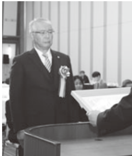
小向おいらせ町副町長