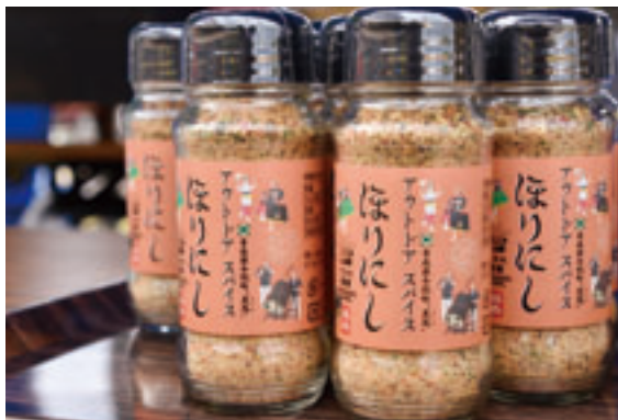
問い合わせ先 道の駅いまべつ半島プラザアスクル TEL 0174-31-5200

これ1本で味がグレードアップ! 万能すぎるアウトドアスパイス「ほりにし」の青森県ご当地ver.は今別町でしか買うことができない限定品です。