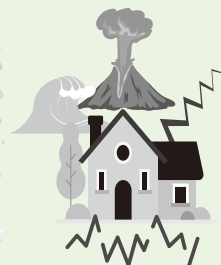
地震・噴火・津波

※水廻り・鍵開けでお困りの際に専門業者を手配し、水漏れを止めたり、開錠作業を行う等の応急処置をするサービス(ホームアシスタンスサービス)を実施しています。(詳細につきましては、町村生協ホームページをご覧ください。)