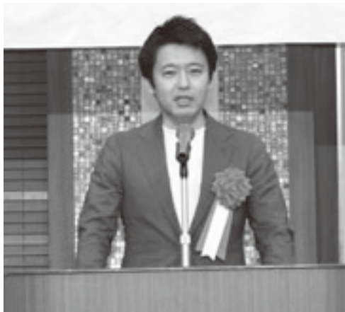
来賓祝辞を述べる宮下知事

収入支出それぞれ2億4349万5千円（対前年度比55.5万2千円 2.2%減）とする。