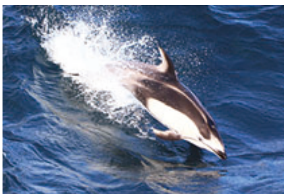
問い合わせ先 むつ湾フェリー 蟹田本社営業所 TEL 0174-22-3020