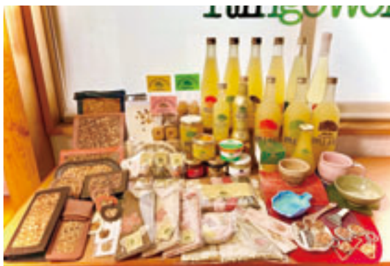
問い合わせ先 板柳町ふるさとセンター TEL 0172-72-1500

「学んで、遊んで、泊まれる」がコンセプトの板柳町ふるさとセンターは、りんご資料展示室や、りんごを使ったお菓子作りや陶芸体験など、りんごにまつわるコンテンツが豊富。温泉・レストランのほかに、売店・喫茶室の「りんごソフトクリーム」が人気。総ヒバ造りのコテージは温泉付き。農産物直売所や無料の足湯も。皆さまのお越しをお待ちしています。