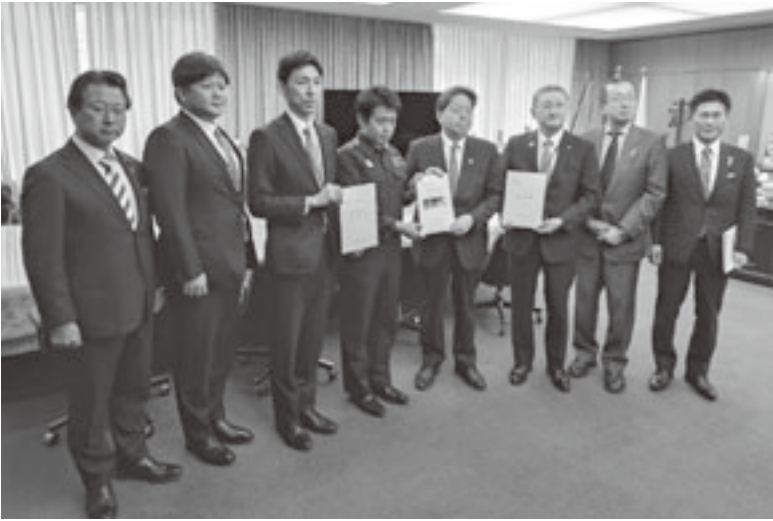
林総務大臣（右から4人目）

国土交通大臣、沓掛道路局長とそれぞれ面談し、町村の実情を説明した。なお、要望書は財務省、内閣府、内閣官房並びに県選出国会議員等にも提出した。