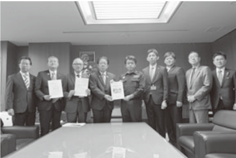
金子国土交通大臣（左から4人目）