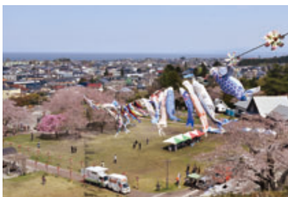
問い合わせ先 野辺地町観光協会 TEL 0175-64-9555

野辺地町の愛宕公園内で開催される「のへじ春まつり」。満開の桜と眼下に広がる陸奥湾、そして空を泳ぐ150匹の鯉のぼりが織りなす景色は圧巻です。会場にはキッチンカーなどの出店も並び、お花見グルメも充実。夜はライトアップされた幻想的な夜桜も楽しめます。ご家族やご友人と、野辺地の春を満喫しにぜひお越しください。