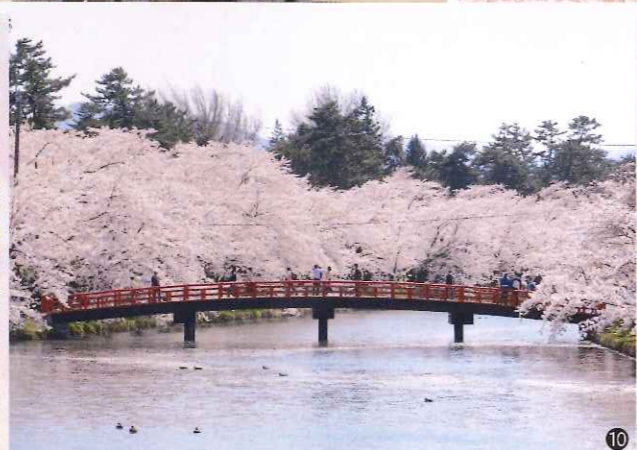
①天守と岩木山／②肩車で背が大きくなった気分／③桜のトンネル／④桜の下で家族の時間／⑤一面の花筏（はないかだ）／⑥同じ目線で見える桜／⑦友人との楽しいひととき／⑧花筏の中を泳ぐ外濠のカモ／⑨西濠の桜を眺めてひと休み／⑩旧紺屋町消防屯所横から春陽橋を眺めて／⑪西濠の歩道を散歩／⑫春陽橋から西濠をパシャリ／⑬ライトアップされた西濠／⑭二宮金次郎像もマスクをつけます