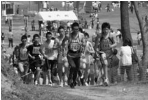
問い合わせ先 樺とサポテンまつり実行委員会 TEL 017-755-2118 夜越山クロスカントリー実行委員会事務局 TEL 017-755-2565

5月3日(火・祝日)、5月4日(水・祝日)の2日間にわたり、夜越山森林公園及び夏泊半島椿山において「第43回樺とサポテンまつり」が開催されます。