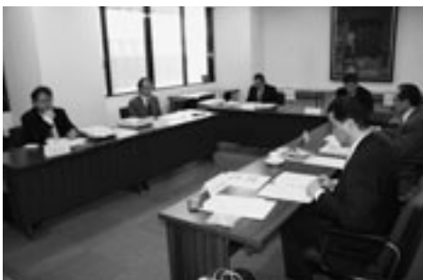
▲広報コンクール審査会の様子

本会に事務局を置く県広報広聴協議会は、二月二日、青森市の県共同ビルで平成二十三年県広報コンクール審査会を開催した。 同コンクールは市町村の広報活動の向上を目的に開催し