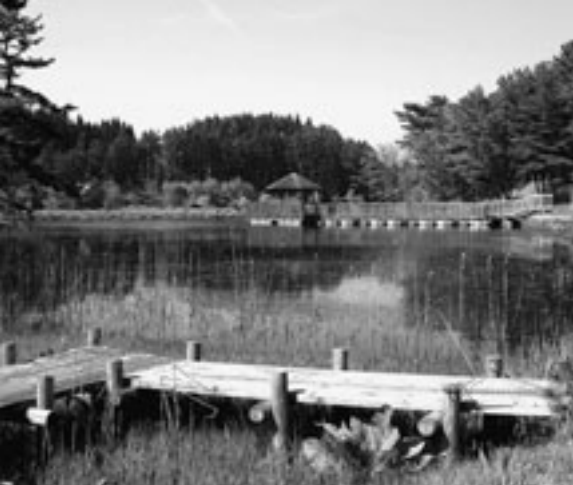
▲松風の聞こえる静かな憩いの場「玉松台」