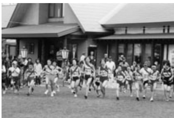
問い合わせ先 野辺地町観光協会 TEL 0175-64-9555