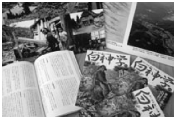
問い合わせ先 ブナの里 白神公社 TEL 0172-81-5050