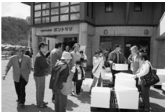
問い合わせ先 道の駅こどもり「ポントマリ」 TEL 0173-27-9300

「道の駅こどもり」は、冬期間休業しておりましたが、4月下旬にオープンします。同駅は、国道339号線の海岸沿い、通称「竜泊ライン」にあるきれいな景色が自慢の駅です。