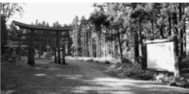
▲中世津軽の歴史を物語るロマン漂う「蓬田城跡」

少子高齢化等の対策としては、妊婦検診のさらなる充実、がん検診の完全無料化、六十五歳以上のインフルエンザ予防接種の助成、新型インフルエンザ予防接種の助成、〇歳から十五歳までの医療費の無料化、障害者の養護と自立できるような支援事業など、子どもやお年寄りや障害者が、住みたくなる地域づくりを指しています。