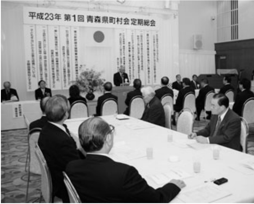
▲定期総会には町村長をはじめ約40人が出席