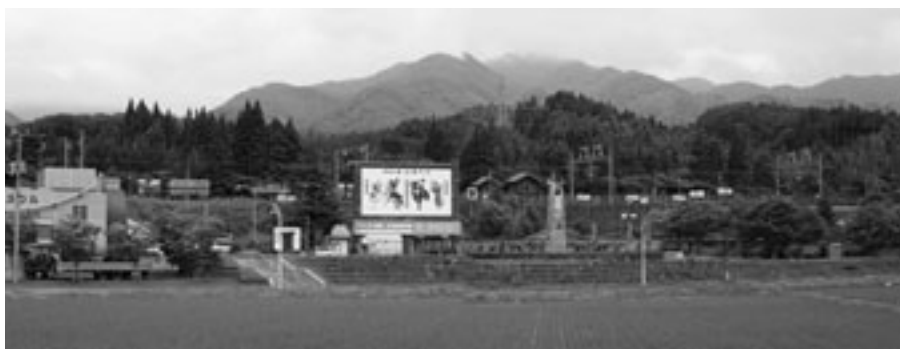
▲仮称「奥津軽駅」設置が予定されている津軽今別駅付近

私達は、仮称「奥津軽駅」開業と、近い将来実現する「トレイン・オン・トレイン」を見据え、特産品の開発など町づくりの全力で取り組んでまいります。