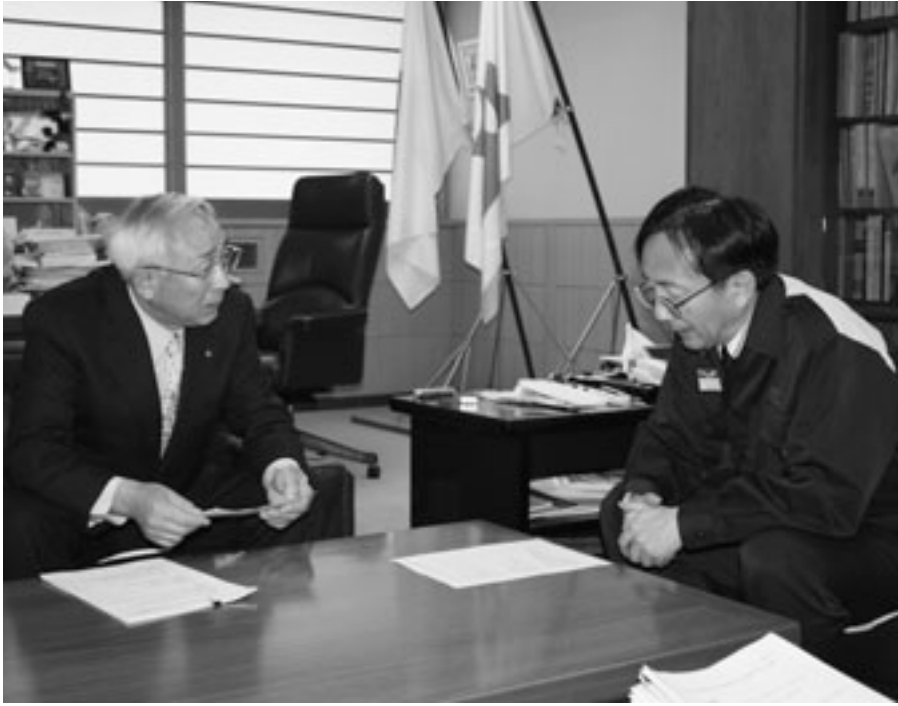
▲逢坂会長が町村の災害復旧に関する課題等を三村知事に説明