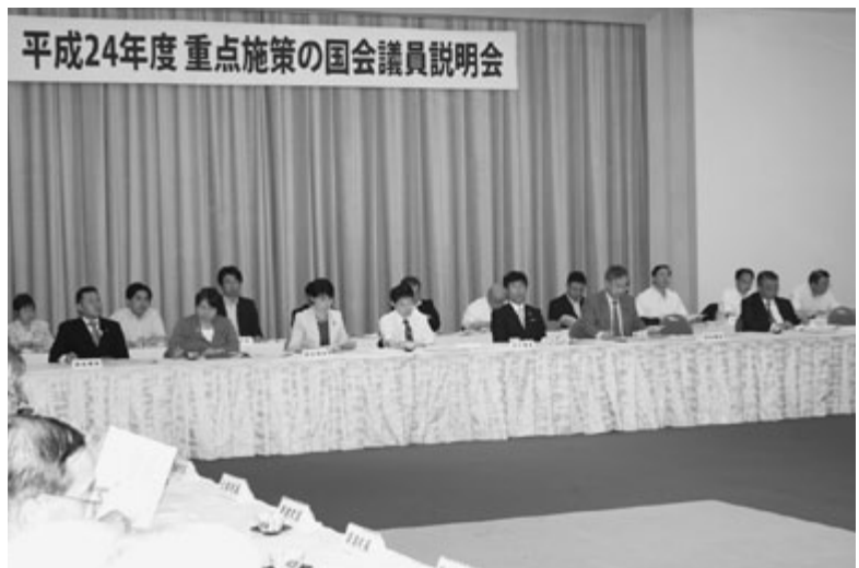
説明会には県選出国會議員7名が出席