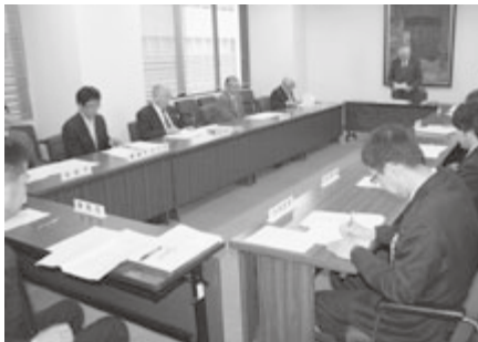
広報広聴協議会理事会の様子

また、任期満了に伴う正副支部長の選任を行い、支部長に関西目屋村長、副支部長に竹原三戸町長をそれぞれ再任した。