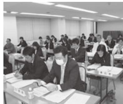
制度の理解を深める参加者

研修会では、山口本会常務理事兼事務局長が「本保険制度の趣旨は、市町村の法律上の賠償金の支出による財政負担の軽減と、スムーズな賠償