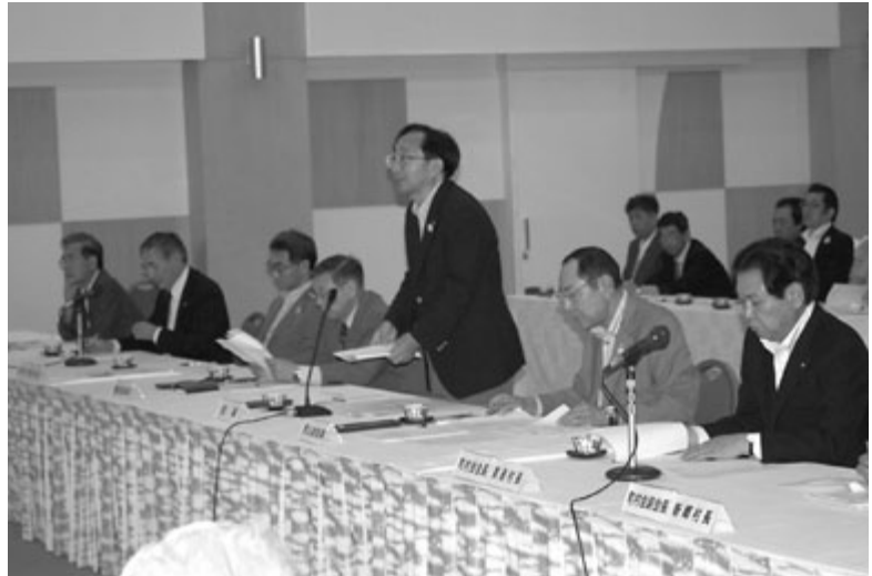
県説明の冒頭で三村知事があいさつ