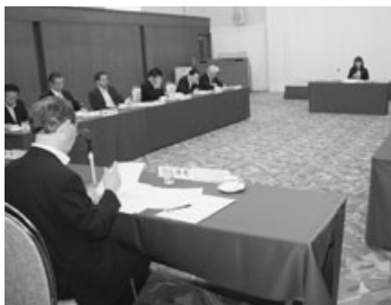
本会総務厚生委員会の様子

臨時会では、報告事項一件を原案どおり承認した後、正副管理者選挙を行い、管理者に越善東通村長、副管理者に関西目屋村長を新たに選任した。また、欠員に伴う副議長選挙を行い、工藤南部町長を選任した。