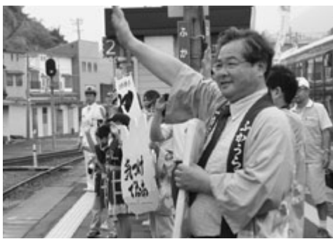
「手を振り隊」が観光客をおもてなし

環境が育んだ農水産物を活用して、内発的な産業おこしを進めようとしています。生産・加工・販売（一次産業×二次産業×三次産業＝六次産業）といったそれぞれの分野を地域全体で担うことにより、農水産物の付加価値を高め、産業界全体の所得向上と地域内経済の循環による活性化を目指します。現在、その中核施設である農水産物一次加工場の整備を進めているところです。