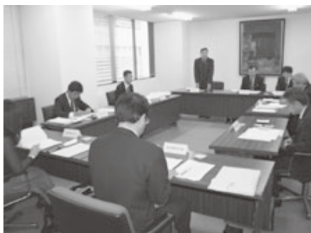
政務担当部長が要望事項等を協議

北海道東北六県町村会協議会（事務局・北海道町村会）は五月十二日、青森市の県共同ビルで北海道東北六県町村会政務担当部長会議を開催し、平成二十四年度政府予算編成並びに施策に関する要望などを協議した。