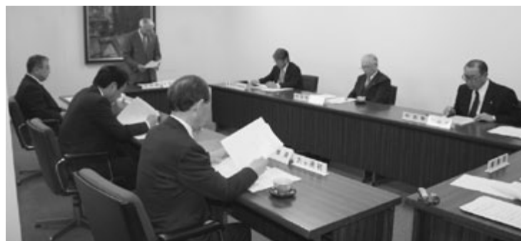
本会災害対策本部会議の様子

本会は、五月十日、青森市の県共同ビルで青森県町村会東北地方太平洋沖地震災害対策本部会議を開催し、逢坂本部長（本会会長）ほか、関係町村長六人が出席した。