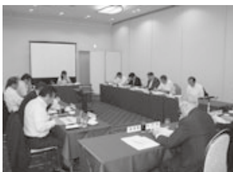
総務厚生委員会の様子

本会は七月十日、青森市の ラ・プラス青い森で、総務厚 生委員会並びに産業経済委員 会を開催し、県各部署と諸案 件について協議した。