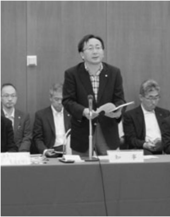
三村知事が県と町村の一層の連携を呼び掛ける

増やすこととしており、国による審査や中国側の調査を経て新たな指定等が行われる。 (8) TPP交渉について WTO農業交渉の日本提案の基本理念である「多様な農業の共存」の立場を堅持し、国内農林水産業の振興と農山漁村地域の活性化を損なうことのないよう対応することが重要であり、今後とも機会を捉えて交渉不参加を国に働きかけていく。 (11) 水産資源の回復・管理の推進について ①サケふ化放流事業に係る体制の強化について 国ではふ化場の施設整備費への支援、