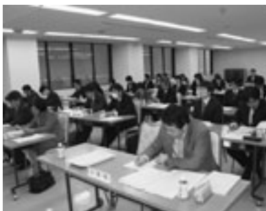
制度の理解を深める参加者

最後に、本会事務局が二十四年度更新加入事務と事故報告書の取扱い及び二十三年加入状況、支払い実績等を説明し、本保険制度に対する理解と協力を求めた。