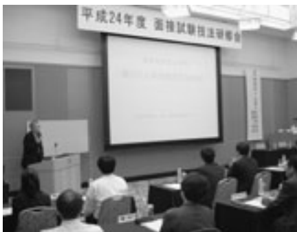
面接技法の理解を深めた研修会の様子

研修会では、模擬面接試験のDVDを観賞し、三人の面接試験官の悪い例と良い例の言葉使いや態度などについて、各グループに分かれて討議し意見交換・発表したほか、グループ別のロールプレイ方式による模擬面接実習を行い、問題点等を各グループに分かれて討議した。