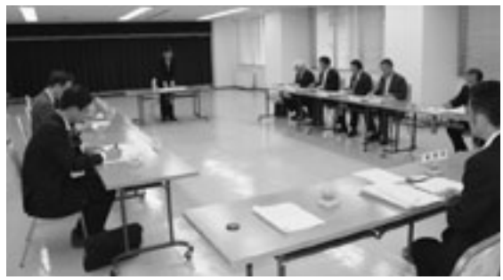
県広報広聴協議会理事会の様子

発電関係市町村全国協議会青森県支部 総会には、関支部長（西目屋村長）をはじめ会員市町村より五人が出席し、収支予算等を承認、決定した。