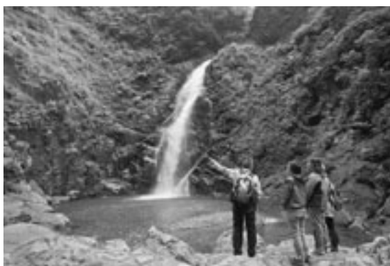
問い合わせ先 西目屋村総務課商工観光係 TEL 0172-85-2800

世界自然遺産白神山地のバッファゾーン内にある暗門の滝歩道が7月開通します。暗門の滝歩道は暗門川沿いに歩道が整備され、手前から第3の滝、第2の滝、第1の滝と順に大きくなっていく滝を見ることができます。歩道沿いには珍しい植物や、川ではイワナの魚影を見ることがあります。大自然を満喫できる歩道となっています。