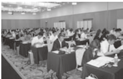
共済事業の更新事務手続き等を説明

また事務局からは、生協火災・自動車共済事業、任意共済・特定疾病保険事業、弔慰金事業、個人年金共済事業の概要並びに更新事務手続きや、公有・生協事故報告及び共済金請求に伴う事務手続き等を説明したほか、車両保険幹事会社である損害保険ジャパン青森支社より車両共済の説明があった。