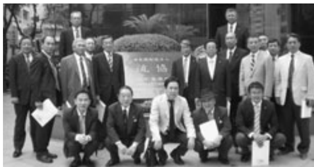
一行は公益財団法人交流協会を訪問