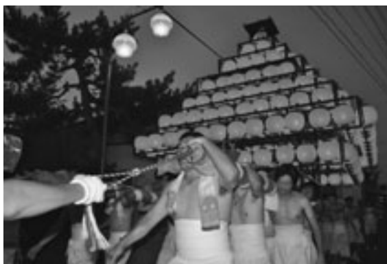
問い合わせ先 板柳町役場経済課 TEL 0172-73-2111

「りんご灯まつり」が8月8～10日の3日間、板柳町役場を主会場に開催されます。りんごの豊作と作業の安全を祈願するこの祭りのメインは、たわわに実るりんごを表している「りんご山笠」の提灯。「ノレサ！ソレサ！」の掛け声で町内を練り歩きます。いろいろな催しもあります。