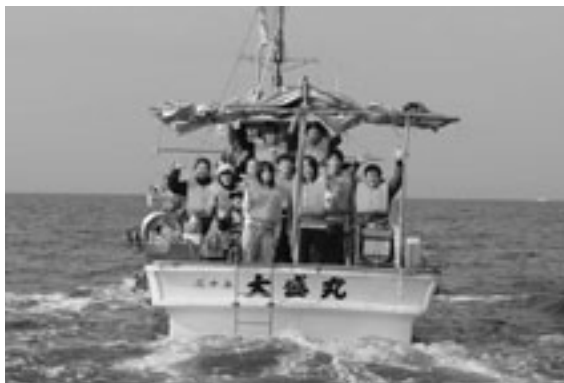
問い合わせ先 平内町漁業協同組合 指導課 TEL 017-755-4111

「漁船で行GO！（いご〜）」は、平内町の土屋漁業研究会が平成19年から実施しているもので、陸奥湾の美しい景色を満喫しながら「ほたて養殖」をはじめ、色々な魚がとれる「刺し網漁」もしくは「カゴ漁」が体験・学習できます。ほたて養殖などの平内町の漁業について、漁師さんのお話を聞いたり、近くを飛ぶゴメ（かもめ）に餌をあげたりと普段体験できないことばかりです。