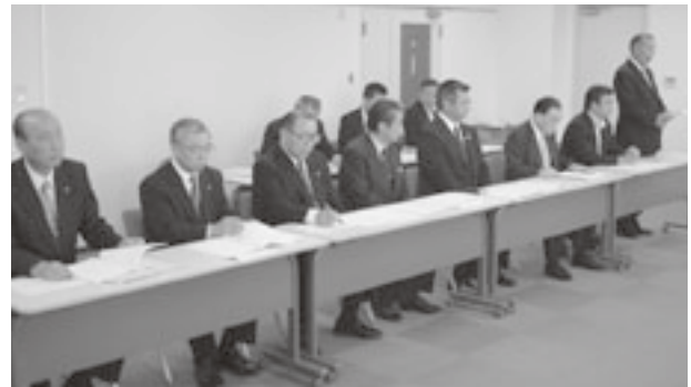
要望には8町村長が参加

に、地元町村の意向も十分尊重するよう配慮を求め実施したものの。 本会からの要望に対し橋本県教育長は、説明会やパブリックコメントなどで広く意見を聞きながら、生徒数の推移なども総合的に勘案して成案を決定する、などと説明した。 要望内容は、次のとおり。