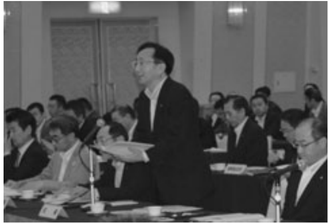
県説明の冒頭で三村知事があいさつ