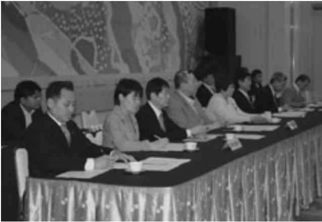
説明会には県選出国議員 8人が出席