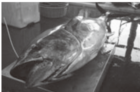
小ぶりながら味の良い「深浦マグロ」

「深浦マグロ」は県内の他地域に比べてやや小ぶりですが、ほどよい脂ののり加減で味の良さには定評があります。また、「深浦マグロ」は津軽海峡のマグロに比べ漁期が長