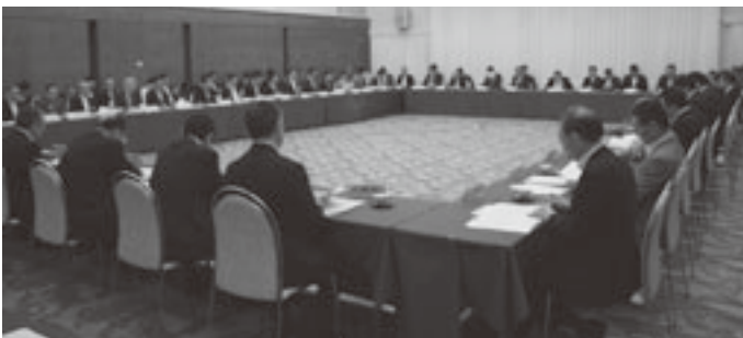
会議には全30町村長が出席

除幕式、記念式典、PR展など広く周知を図るための取り組みを行ってきた。今後も各種イベントや首都圏観光キャンペーン等の開催により情報発信するほか、新たな旅行商品の開発等を推進する。