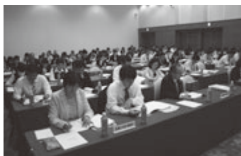
担当者が更新事務手続き等の説明を受ける

また、事務局からは生協火災・自動車共済事業、任意共済・特定疾病保険事業、弔慰金事業、個人年金共済事業の概要並びに更新事務手続きや、公有・生協事故報告及び共済金請求に伴う事務手続き等を説明したほか、車両保険幹事会社である損害保険ジャパン青森支社より車両共済の説明があった。