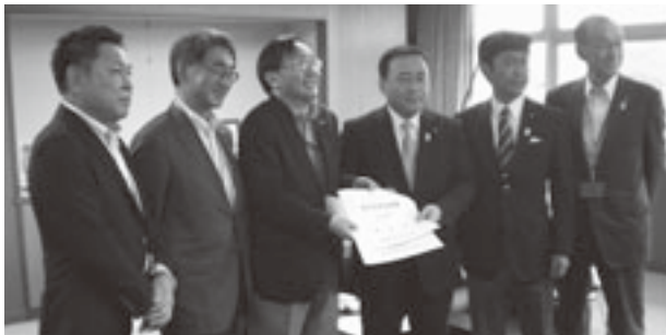
国土交通省の梶山副大臣（右から3人目）へ要望