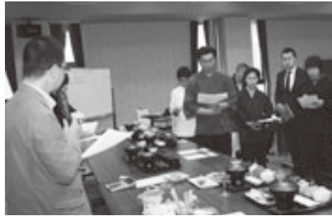
試食検討会を含め40回以上の開発会議を実施

全国の新OMOTENA SHIご当地グルメをプロ デュースしている専門家の助 言を受けながら、参加店の料 理長や生産団体・町関係者で 話し合いの場を持ち、何度も 試作を重ね、ようやく完成し たのが「深浦マグロステーキ 丼」、愛称「マグステ丼」です。