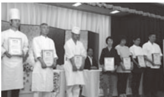
公式提供店認定書を手にする「チーム深浦」のメンバー

性的です。販売価格 は、全店共通で一膳 千二百円（税込）で、 替え玉ならぬ「替え マグ」でマグロのお 代わりも可能です。 （別途料金二百五十 円（税込））。 「チーム深浦」が 一致団結して完成さ せた新しいご当地ゲ ルメ「深浦マグロ ステーキ丼」。ぜひ、 各店オリジナルのマ グステ丼をご賞味く ださい。