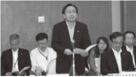
三村知事が県と町村の一層の連携を呼び掛ける