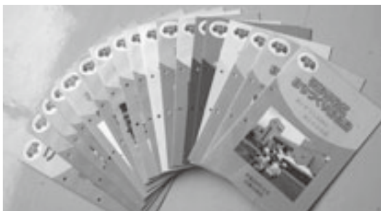
協働のまちづくり地区計画書

る、町民の手による町民のた めのまちづくりを理念に、町 内十九の全行政区が独自に 「協働のまちづくり地区計画 書」を作成し、それを町の「第 四次階上町総合振興計画」に 盛り込み反映させました。昨 年度は、各地区計画を自分た ちの手で見直しをして「後期 計画」も完成しております。 住民自治の原点である自己 決定、自己責任の原則のもと、 行政と町民が手を携えて活力 のあるまちづくりに向かって、 『三陸復興国立公園指定』と いう節目の今年は特に、さら なる魅力あふれる階上町実現 を目指してまいります。