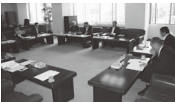
全国山村過疎地域振興連盟県支部理事会の様子

また、任期満了に伴う正・副支部長の選任を行い、支部長に関西目屋村長、副支部長に竹原三戸町長をそれぞれ再任した。