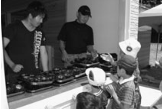
問い合わせ先 外ヶ浜町産業観光課 TEL 0174-35-1228

今年も平館産の新鮮なウニを殻付きで皆さんにご提供いたします。ご家族、お友達をお誘いあわせのうえ、ぜひお越しください。