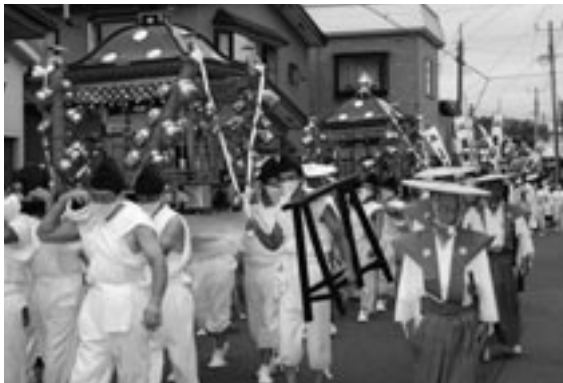
問い合わせ先 白八幡宮大祭保存会事務局(鯨ヶ沢町役場内) TEL 0173-72-2111

300年以上続く伝統行事で4年に1度行われる「白八幡宮大祭」が、今年8月14日～16日に開催されます。御神輿渡御行列は、「津軽の京まつり」ともいわれ、二基の神輿を中心に古式ゆかしい装束に身をまとった人々がおよそ1kmの行列となって進み、その後には各町内の山車が続きます。最終日には港町ならではの海上渡御も行われます。