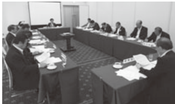
総務厚生委員会の様子

臨時会では、任期満了に伴う正・副管理者選挙を行い、管理者に館岡板柳町長、副管理者に古川六ヶ所村長を新たに選任したほか、監査委員に金澤大間町長を選任した。