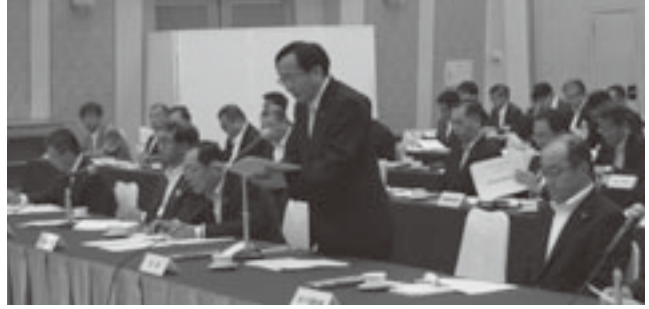
三村知事が主催者を代表してあいさつ

本会は、県、市長会の三者合同により六月十四日、東京都内で、自由民主党をはじめ総務省、厚生労働省、農林水産省、国土交通省、環境省並びに県選出国會議員に対し、平成二十六年度の重点施策提案を行った。 本会からは越善会長が出席し、国土交通省の梶山副大臣、自由民主党の大島復興加速化本部長、浜田幹事長代理及び関係省庁幹部に面談のうえ、本県の実情を強く訴え施策の実現を求めた。