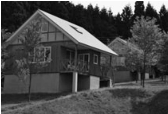
問い合わせ先 あじらの森キャンプ場管理棟 TEL 0172-47-6664

あじらの森キャンプ場は大鰐温泉スキー場高原エリアに隣接しており、眼下にはゲレンデの草原が続き、遠くには岩木山が遠望できる高原のキャンプ場です。