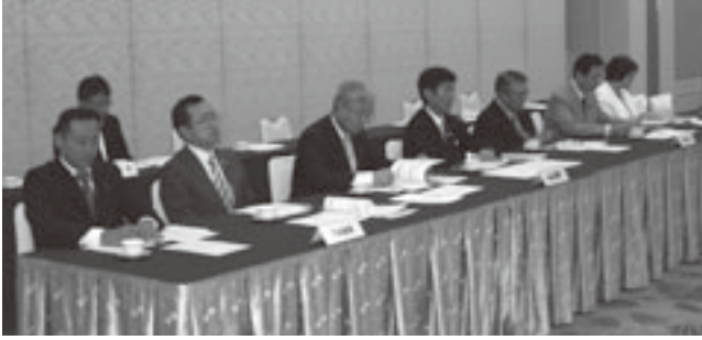
説明会には県選出国會議員7人が出席