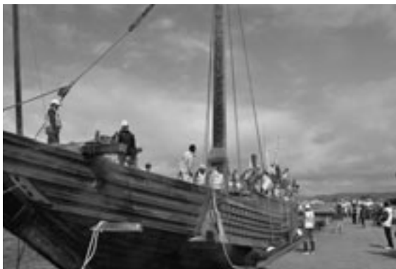
問い合わせ先 のへじ常夜燈フェスタ実行委員会 (事務局:野辺地町地域戦略課) TEL 0175-64-2111

常夜燈、北前船など、野辺地町の基盤を築いてきた「海」をテーマにした「のへじ常夜燈フェスタ」が7月20日(土)のへじ潮騒公園で開催されます。