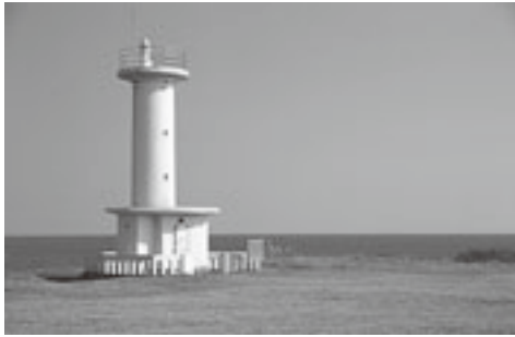
三陸復興国立公園に指定された階上海岸

山と海の美しい自然資源に 生まれた階上町は、青森県最 東南端に位置することから、 県内で最初に朝日が昇る「光 生す町」と謳っております。 地元階上町に生まれ大学卒 業後、県農業改良普及員とし て務めました。その間カリ フォルニア州で一年間農業研 修の機会に恵まれアメリカを 感じてきました。野望を抱き 意気込んでいたところ、父親 の急逝で退職すること…。