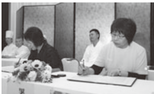
緊張の中行われた協定調印式

※「深浦マグロステーキ丼」 に関するお問い合わせは、深 浦マグロ料理推進協議会事務 局までお願いします。【電話 0173（74）2111】 HP: www.fukaورانaguro.com/