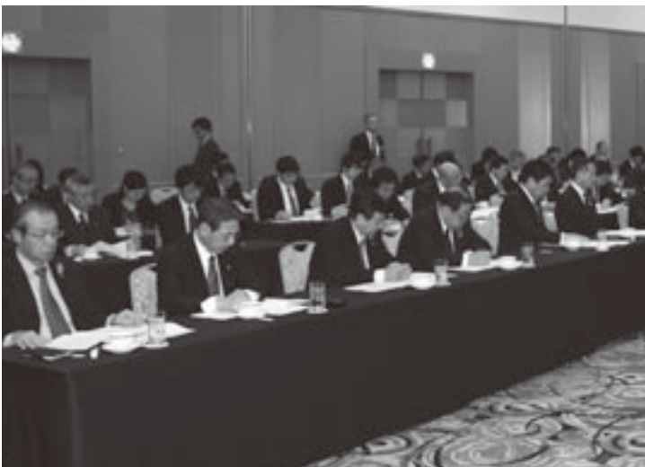
研修会には町村長等約80人が出席