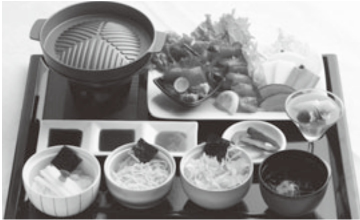
これが「深浦マグロステーキ丼」です！

マグロ以外の食材も、でき る限り地産地消にこだわり地 場産を使用しており、井に 使用しているお米はもちろ ん、刺身丼に使用されている 長芋は、町内産長芋（ネバリ スター）です。また、季節の 野菜、香の物をはじめ、汁物 は町特産品の「つるつるわか め」を使用するなど各店こだ