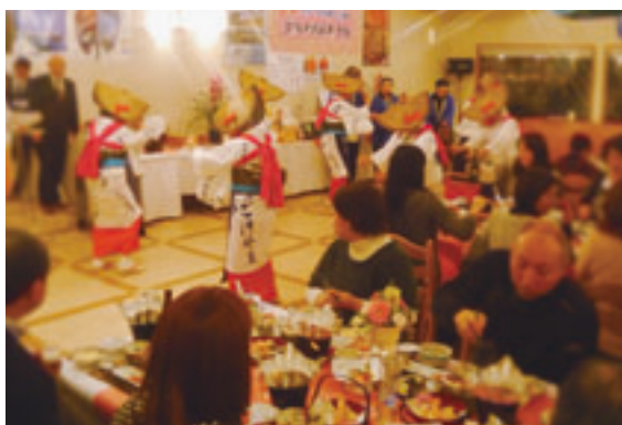
問い合わせ先 深浦町観光協会 TEL 0173-74-3320