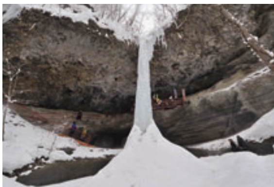
問い合わせ先 目屋観光協会事務局 (西目屋村役場産業課内) TEL 0172-85-2800

冬に乳穂のように氷結することからその名がついた乳穂ヶ滝。昔から氷結した滝の太さ、形状等によってその年の津軽の作物の豊凶が占われてきました。