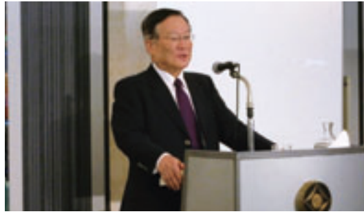
森本氏が国際情勢について講演