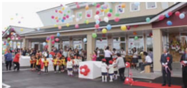
平成25年6月 農産物加工販売施設「ピュア」オープン

事が行政運営を行うことができたと私なりに評価しております。 ただ、合併当初の予測を遙かに超える過疎化、少子高齢化の進展は引き続きの課題として対策を講じていかなければなりません。これらの解消を図るためには、町の主産業である農業と漁業を中心とした関連産業の振興を図り、人口の定住化を進めていくつもりであります。 全国的にも米価の暴落や燃油の高騰などで農林水産業を営む生産者は存亡の危機にありますが、国の地方創生に取り組む姿勢を期待し、特色があり付加価値をつけた商品開発やその販売への取り組みに対し、今後も積極的に支援していきたいと考えております。 また、福島第一原子力発電所の事故発生以来、農林水産品の風評被害も大きく、消費者はより安全安心な食材を求めるようになりました。これらに対応した商品の生産拠点を構築することが町活性化のカギであると考えております。 その試みの一つとして、平成二十五年六月にオープンし