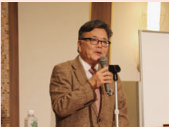
▲日本の政治について与良氏が講演

本会は、県市長会、県市町村振興協会との共催により、十月二十日、青森市のホテル青森で本会創立九十周年記念講演にも位置付けた、市町村長等特別研修会を開催した。出席者は市町村長や幹部職員等約百人。