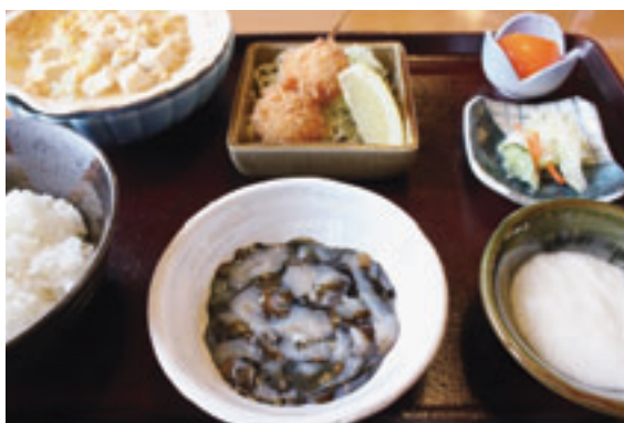
問い合わせ先 横浜町役場産業振興課 0175-78-2111(内線351)

陸奥湾産の「横浜なまこ」の真のおいしさを皆様に知っていただく為に12月1日(月)から12月14日(日)まで開催され、好評のうちに終了しました。