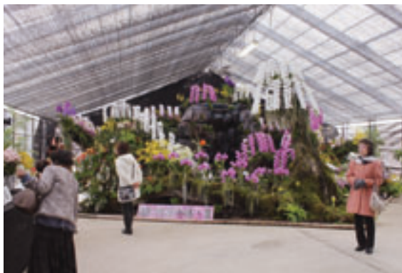
問い合わせ先 夜越山森林公園 公園管理事務所 TEL 017-755-2663

夜越山森林公園サボテン園では、300坪のサボテン温室、100坪の洋ラン温室及びベゴニアの温室があり、冬でも南国気分を味わうことができます。