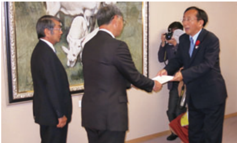
三村知事（右）に要望する館岡会長（左）と鹿内市長会会長（中央）

の下落に対する対策について、国への働きかけなどを求め実施したもの。一行は要望内容の実現を強く求めた。要望内容は、次のとおり。