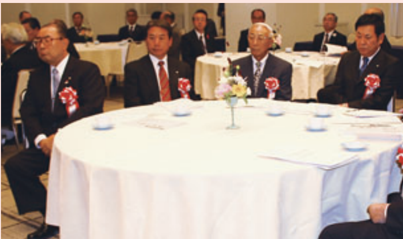
▲感謝状を受けた歴代本会会長 左より小野中泊町長、工藤南部町長、逢坂前平内町長、越善東通村長