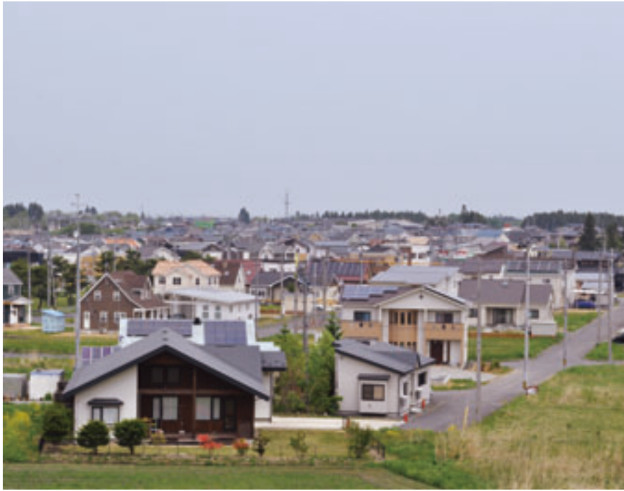
六戸町の人口増の牽引役「小松ヶ丘団地」