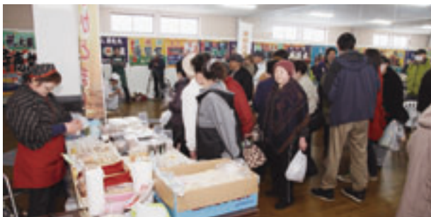
ストーブ列車の乗客を出迎える「駅ナカにぎわい空間」

もちろんこの取り組みは、平成二十二年十二月に全線開通となった東北新幹線に対応したものでありましたが、東日本大震災の発生を受け、盛んに行われていた開業イベントもトーンダウンせざるを得ない状況となったことを記憶しております。