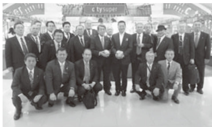
香港シテイスーパータイムズスクエア店を視察

蘇州市では、蘇州太湖国家観光リゾート区・緑光農園で行われている温室ハウスでのトマト、イチゴ、ハーブの栽培状況を視察した。同農園は、約三十三万㎡あり、そのうちの約三万㎡の温室で野菜・果物を栽培しているほか、ゴーカート場、レストラン、ホテル等も備えている。農業だけでは経営が難しいので観光施設も備え「観光農園」としての取り組み等について説明があった。