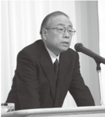
石田氏が「新たな農業農村政策」について講演

新たな施策を展開していくことに資するためにも、本研修会が実り多いものとなることを期待している。」とあいさつした。