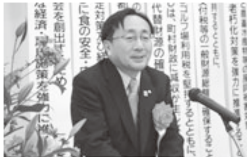
三村知事が来賓祝辞を述べる

表彰終了後、来賓の三村知事が祝辞を述べ、また、同じく来賓として出席の仙谷県町村議会議長会会長、中村県総務部長、田中県総務部市町村課長が紹介された。