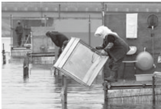
問い合わせ先 外ヶ浜町役場産業観光課 TEL 0174-31-1228

しろうおが遡上する蟹田川で、産卵のために戻ってくる時期に合わせ、約一か月間繰り広げられる「蟹としろうお祭り」。期間中、河川敷には飲食店が設けられ、踊り食いをはじめとした、とれたてのしろうおを使った料理が堪能できます。