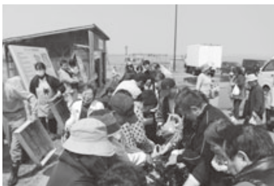
問い合わせ先 中泊町役場水産観光課 TEL 0173-64-2111

4月中旬の国道339竜泊ラインの冬季閉鎖解除に合わせ、道の駅こどもりがオープンします。