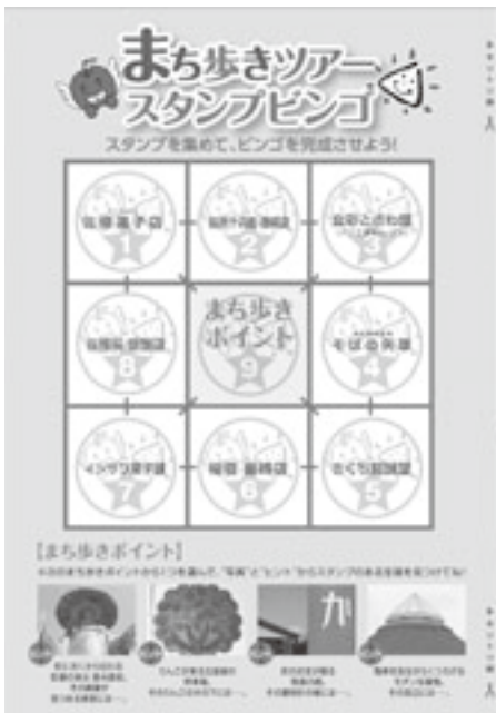
まち歩きツアースタンプビンゴ

ふじりんごロール (アントルメ佐藤菓子店) 店自慢のロールケーキにふじりんごのフレッシュプレザーブが巻き込まれています。アクセントにカラメルソースと合わせたほろ苦いりんごをのせて、食感を良くしています。