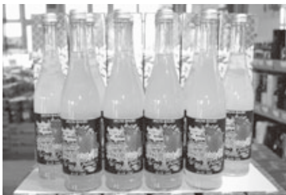
問い合わせ先 道の駅つるた「鶴の里あるじゃ」 TEL 0173-22-5656

新作リキュール『林檎のお酒 Filer（フィレール）』が、道の駅つるた「鶴の里あるじゃ」で販売されています。