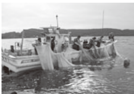
「宝湖」でのシラウオ漁

東北町は、県の東部、上北地方のほぼ中央に位置し、平成十七年三月三十一日旧東北町と旧上北町との二町の合併で、人口二万六千人(二〇〇五年国調)の新しい「東北町」としてスタートした基幹産業が農業の自然豊かな町であります。