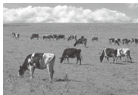
広大な土地を活かした畜産業

国が推し進める地域の農林水産物や資源を活用した六次産業化、農商工連携、地産地消の取り組みを積極的に推進することが今求められているところであり、その試みの一つとして県内でもトップクラスの生産量を誇る生乳の加工(ヨーグルト、チーズなど)に取り組み、安くて安全安心な食材を求める消費者ニーズに添った事業展開を模索中であり、地域特性を活かした産業育成と交通環境に着目したまちづくりを推進しております。