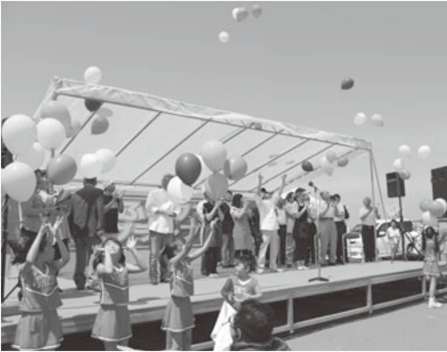
ふじワングランプリ開会式

藤崎町は農業を基幹産業とし、他に誇ることのできる農産物が数多く存在しています。町では、農業と「食」を結びつけた観光施策を推進し、まちの魅力づくりに努めています。