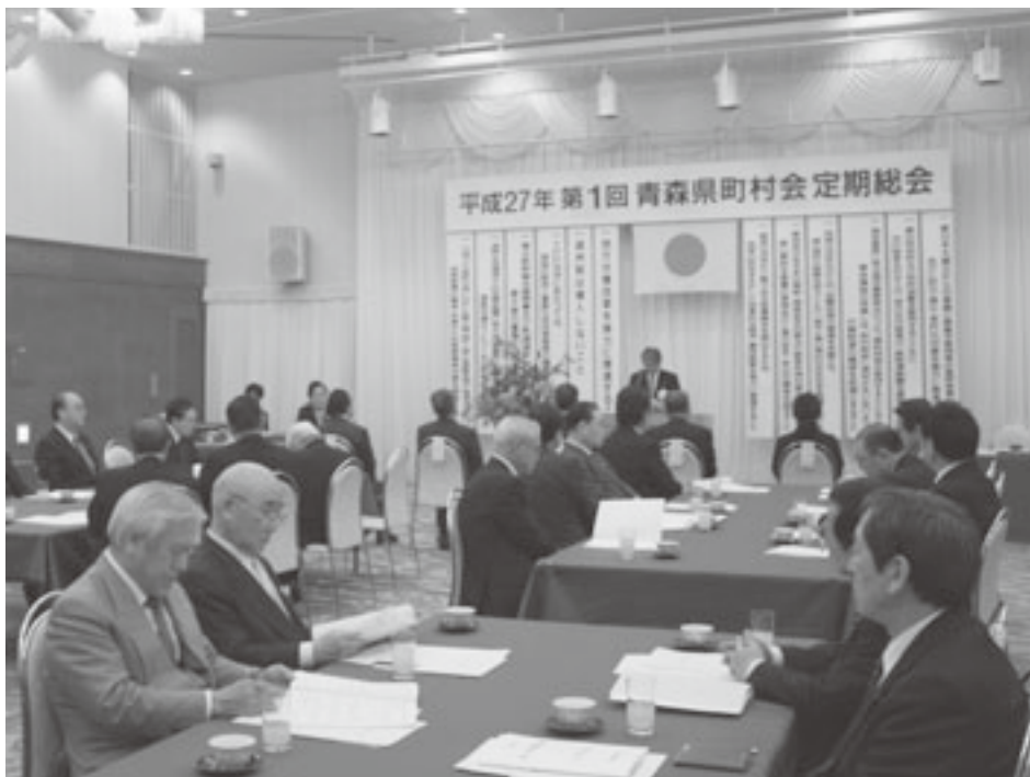
定期総会には町村長をはじめ約40人が出席