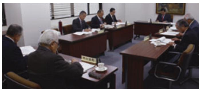
議案4件と報告事項6件を審議

事項の報告及び承認を求めるの件（平成二十八年専決第二号）青森県市町村総合事務組合職員の分限に関する手続及び効果についての条例の一部を改正する条例） Ⅱ 地方公務員法第二十三条の二規定による人事評価の実施等により、職員の降給の事由及び手続を定め、その他所定の整備を