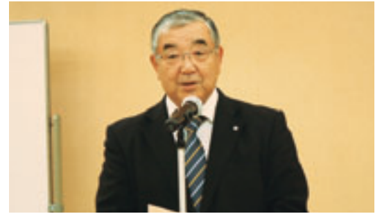
吉田会長があいさつ

本会は、県市長会、県市町村振興協会との共催により、十月七日、青森市の青森国際ホテルで市町村長等特別研修会を開催した。出席者は市町