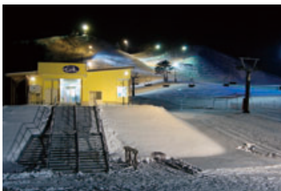
問い合わせ先 七戸町スキー場 TEL 0176-62-5612

さむ～い冬は、つつい家に引きこもりがち…。そんな冬こそ体を動かし、正月太りを解消しよう！コースの斜度は15度～35度と、初心者から上級者まで幅広く対応。他にはない格安設定で、皆さまをお待ちしています。