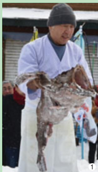
1 村伝統、雪中切りの美演を観ることができる 2 3 4 地域の方々が丹精に作るあんこう鍋。会場ではあんこう鍋400杯のほか、あんこう鮫350セットが安価で販売される 5 昨年2月、「ふるさと名物応援宣言」を行った時の様子 6 会場ではあんこうと記念撮影が行える

価格の低迷、さらには漁業者の高齢化と後継者不足に悩まされています。 観光業では、室町時代から湯治場として有名な下風呂温泉があり、下風呂温泉郷の宿泊施設では、四季を通じて近海で水揚げされる新鮮で種類豊富な海の幸を提供していま