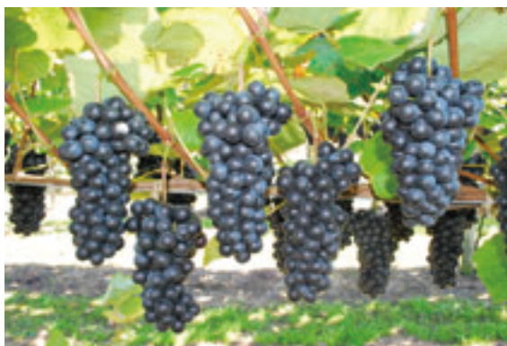
問い合わせ先 鶴田町役場産業観光課農業振興班 TEL 0172-22-2111（内線291）

生産量日本一を誇る鶴田町のスチューベンは、糖度が18度から22度とぶどうの中でも群を抜いて甘く、秋の収穫から翌年2月頃までおいしく食べられます。