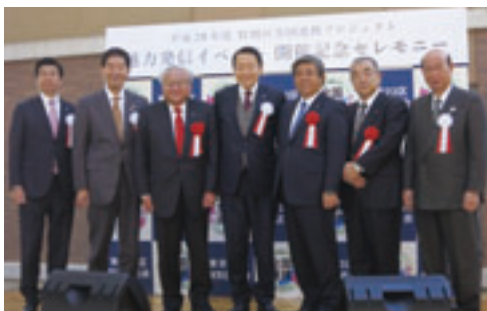
開催記念セレモニーの様子

十二月十六日から十八日までの三日間、特別区長会が主催する「特別区全国連携プロジェクト」が、東京都浅草の「まるごとっぽん」で開催された。「特別区全国連携プロジェクト」は、東京二十三区が全国各地域と様々な分野で連携し、経済の活性化、まちの元気につなげる取り組みであり、平成二十八年六月、特別区長会と本会及び県市長会は連携協定を締結している。その一環として本イベントでは、連