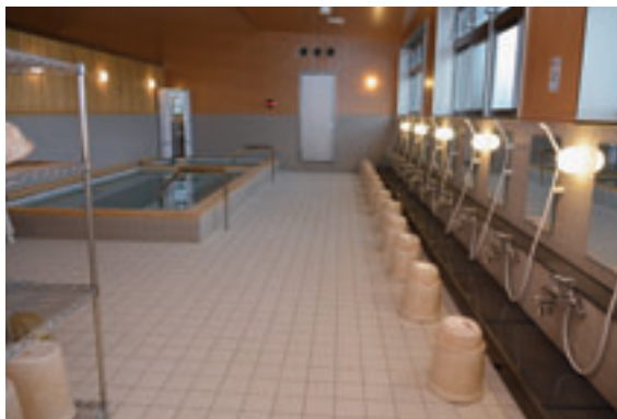
問い合わせ先 mimamaya yoshitsune no yu TEL 0174-31-0300

義経伝説が伝わる外ヶ浜町三厩地区に、新しく「外ヶ浜町健康増進センター・みんなまよしつねの湯」が出来ました！