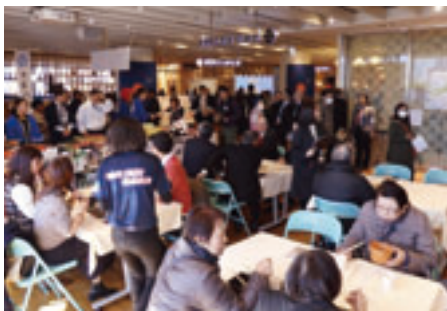
会場には多数の来場者が訪れた

携協定を締結した北海道、京都府、青森県の各自治体が参加し、それぞれの「食」や「まち」の魅力をPRした。会場内では、各自治体自慢の旬の食材を使ったおでんを販売する「こだわりおでんサミット」ブースや、地酒の飲み比べができる「こだわり地酒BAR」ステージなどに、多数の来場者が訪れた。そのほか、PRステージでは、ご当地キャラクターによる自治体のPRや、郷土芸能が披露されるなど、各地域の「魅力」を首都圏に広く発信した。