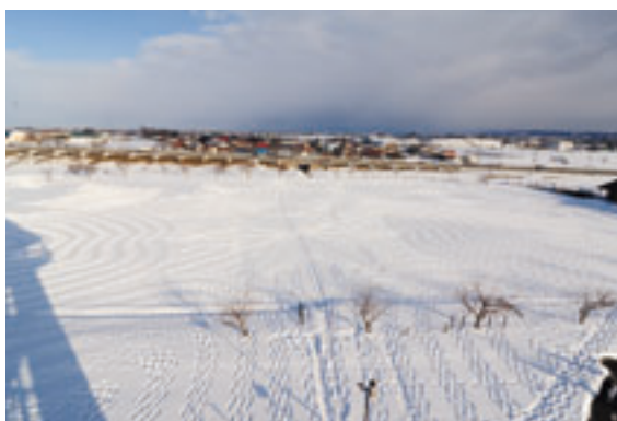
問い合わせ先 田舎館村役場企画観光課 TEL 0172-58-2111