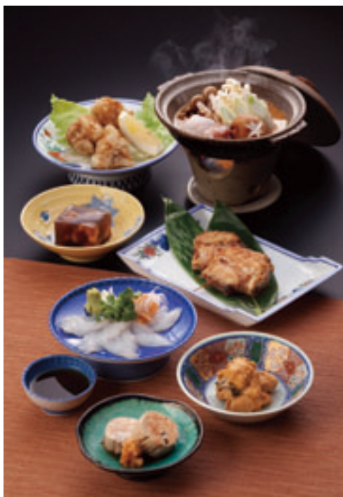
あんこうのフルコース料理

ができ、身は柔らかく、皮やひれ、胃、卵巣、えらなどは弾力に富んだ食感で、鍋などに重宝されます。