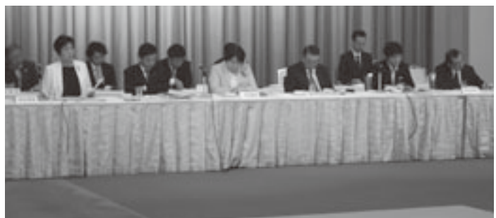
県選出国會議員6人が出席

じて容認できないものであり、交付税を含め地方に必要な財源を必ずや確保するようお願いしたい」とあいさつを述べ、引き続き本会事務局から、地方創生の推進や地方財政基盤の充実・強化など、七項目の重点施策を説明した。(本会重点施策の説明項目は左記のとおり)。 また、県から、新たな課題に対応できる消費者行政推進のための交付金制度の見直しなど十八項目、市長会から、農業分野における外国人技能実習制度の規制緩和など十二項目の重点施策を説明した。