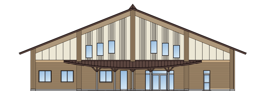
建設が進む「（仮称）ハマの駅」

町では現在、海業支援施設「（仮称）ハマの駅」の来春オープンに向け準備を進めています。同施設はレストランや産