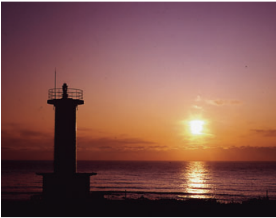
県内で一番早く朝日が昇る小舟渡海岸

光のふるさとといわれている階上町は、青森県の最東南端に位置し県内で最も早く朝日が昇り、元朝参りには多くの人々が階上岳や階上灯台でご来光を拝みます。 平成二十五年五月に階上岳と階上海岸が八戸市種差海岸と共に三陸復興国立公園に指定されたことを契機として、地域資源と人を活かしたまちづくりが進められています。