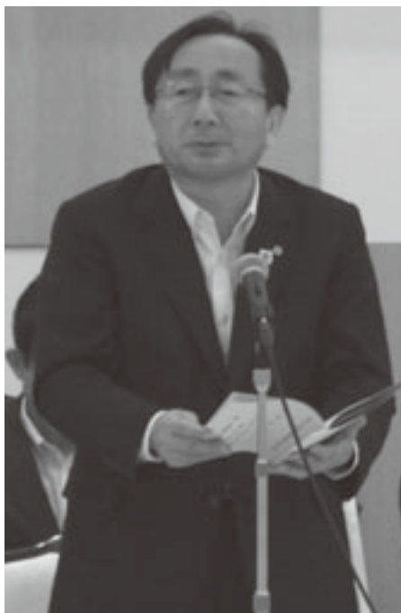
三村知事が県と町村とのより一層の連携を 呼びかける

を推進するための財源確保に ついては、緊急防災、減災事 業債の恒久化や対象事業の拡 大などについて、十分な予算 が安定的かつ継続的に確保さ れるよう国に働きかけていく。 9. 観光客誘客対策の強化に ついて＝北海道新幹線開業に より、本県と道南地域の時間 が大幅に短縮されており、ま た、近年増加傾向にある海外 からのチャーター便も活用し ながら、新幹線をはじめ、海 路・空路の多様な交通機関を 組み合わせた立体観光を引き 続き推進する。