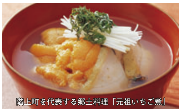
階上町を代表する郷土料理「元祖いちご煮」

は七月二十九日（土）・三十日（日）に開催されます。磯の香り、ウニの甘さ、アワビの歯ごたえのハーモニーをぜひ味わってみてください。