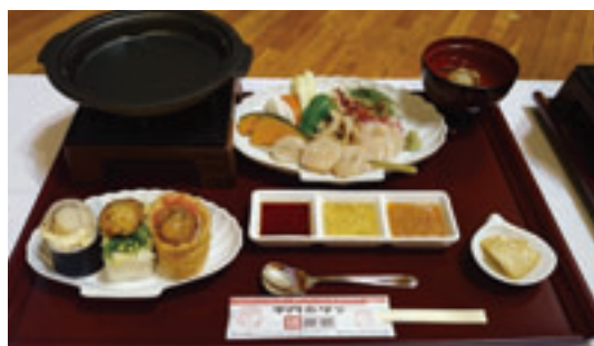
平内ホタテ活御膳

陸奥湾のホタテは遊離アミノ酸が豊富に含まれていることから、特に濃厚な甘みとうま味があるとされております。是非、平内町へお越しください。ご賞味ください。