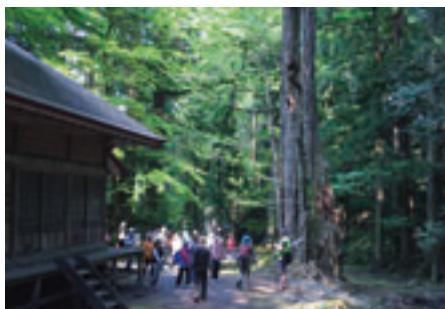
巨木・古木めぐり

年の「茨島のトチノキ」など、町に点在する国内・県内最大級の二十三本の中から、毎回十本程度の巨木・古木を「階上売り込み隊」のガイドで巡るもの。力強い生命力を感じさせる巨木に触れながら全国的に珍しい巨木の郷を堪能できます。