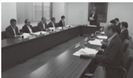
青森県広報聴協理事会の様子

また、発電関係市町村全国協議会県支部は、任期満了に伴う役員を選任を行った。各団体の理事会、総会の概要は次のとおり。