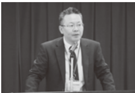
あいさつする小沢課長

最後に、本会事務局が加入依頼書の記入方法や平成十八年度取扱状等を説明し、本保険制度に対する理解と協力を求めた。