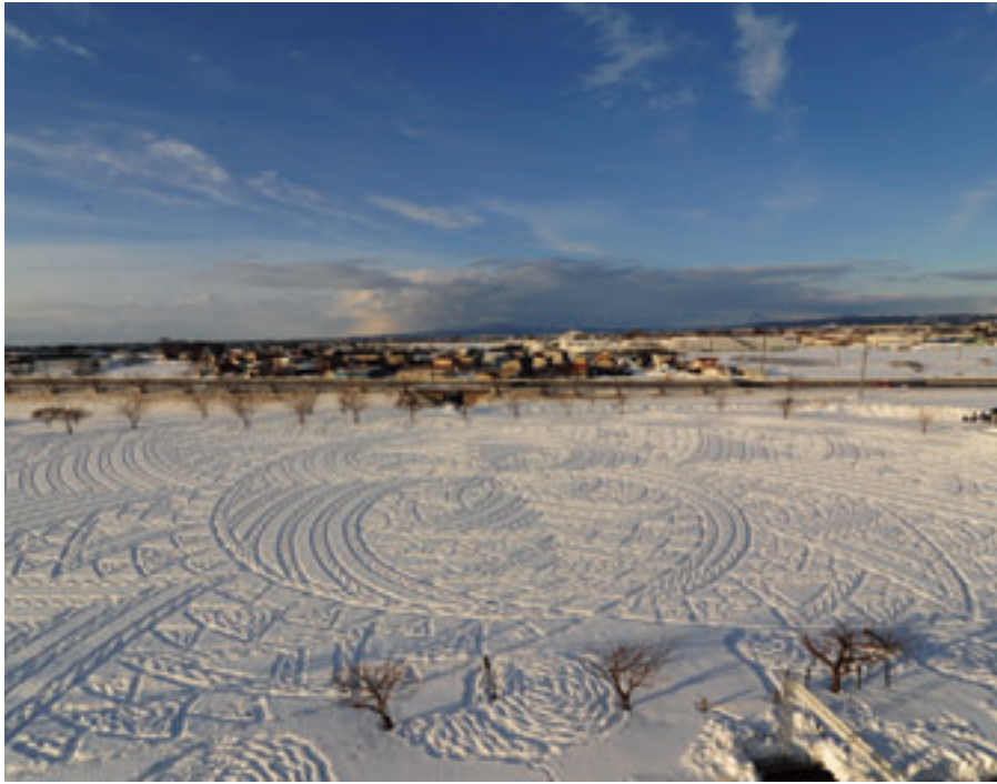
Simon Beck's snow art 「LOVERS EMBRACING (恋人たちの抱擁)」(2017年)