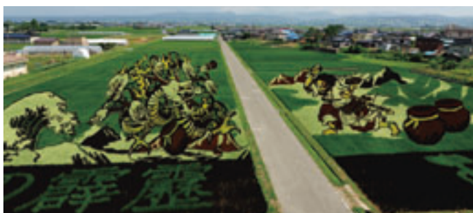
田んぼアート「ヤマタノオロチとスサノオノミコト」(2017年)

上をスノーシューと呼ばれる専用の靴で歩き、その足跡で絵を描くというもの。二〇一六年と十七年の二年間は、世界で唯一のスノーアートの