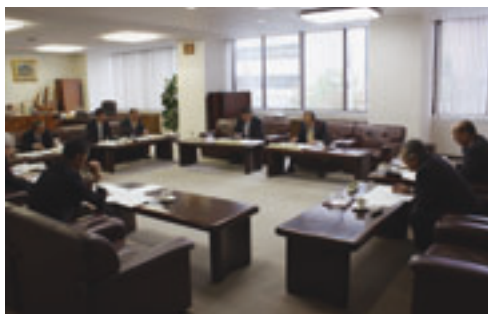
45団体の次年度負担金を審査

本会は十月十一日、青森市の県共同ビルで負担金等委員会を開催した。出席者は関会長をはじめ委員の町村長八人。本委員会は、各町村の非常に厳しい財政状況の中、財政をさらに圧迫する法令外負担金等の負担内容を明確化し、町村行財政の安定と効率的運営を図るため開催するもの。