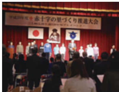
平成29年度「赤十字の里づくり推進大会」

人々の感動を呼びました。その赤十字旗は、今もなお日本赤十字社青森県支部に展示されております。