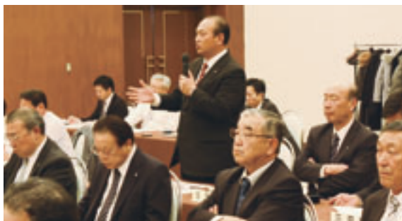
町村長をはじめ30人が出席

あった。説明後、意見交換が行われ、町村長らは町村における地域医療の厳しい現状と、医師不足対策の必要性を訴えた。