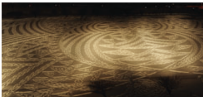
ライトアップされ幻想的なスノーアート

ファルトの上に敷き詰めて制作。田んぼアートに併設されており「惜しまれる人」がテーマとなっています。一つの作品の展示期間は二年間で、二〇一七年・十八年の作品は「プリンセス・ダイアナ（故ダイアナ元妃）」。今年は新たな作品も制作される予定です。