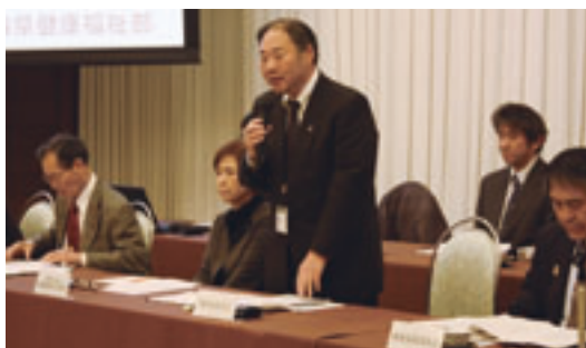
菊地県健康福祉部長があいさつ

十二月二十一日、青森市のラ・プラス青い森で県健康福祉部の主催により、医師不足対策に関する町村長と県健康福祉部の意見交換会が開催された。出席者は町村長など三十人。