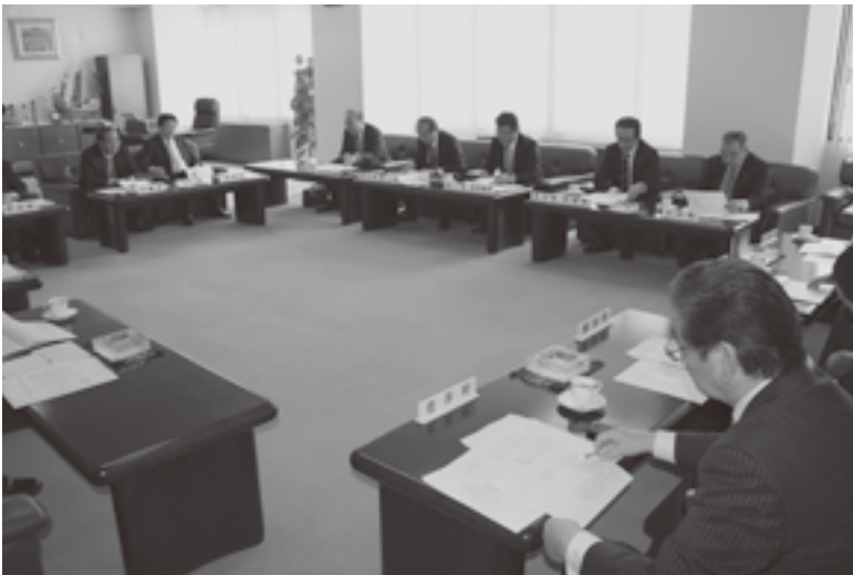
市町村長会議の提言事項を協議

本会は三月二十六日、青森市の県共同ビルで平成三十年第二回理事会を開催した。出席者は、関会長をはじめ役員町村長(理事代理含む)十三人。