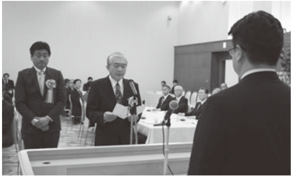
謝辞を述べる坂本南部町副町長