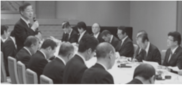
まち・ひと・しごと創生総合戦略改訂版について説明する唐澤地方創生総括官

衆議院議長公邸では、大島議長との歓談後、「まち・ひと・しごと創生総合戦略（二〇一七改訂版）」について、内閣官房まち・ひと・しごと創生本部事務局の唐澤剛地方創生総括官から説明を受けたほか、