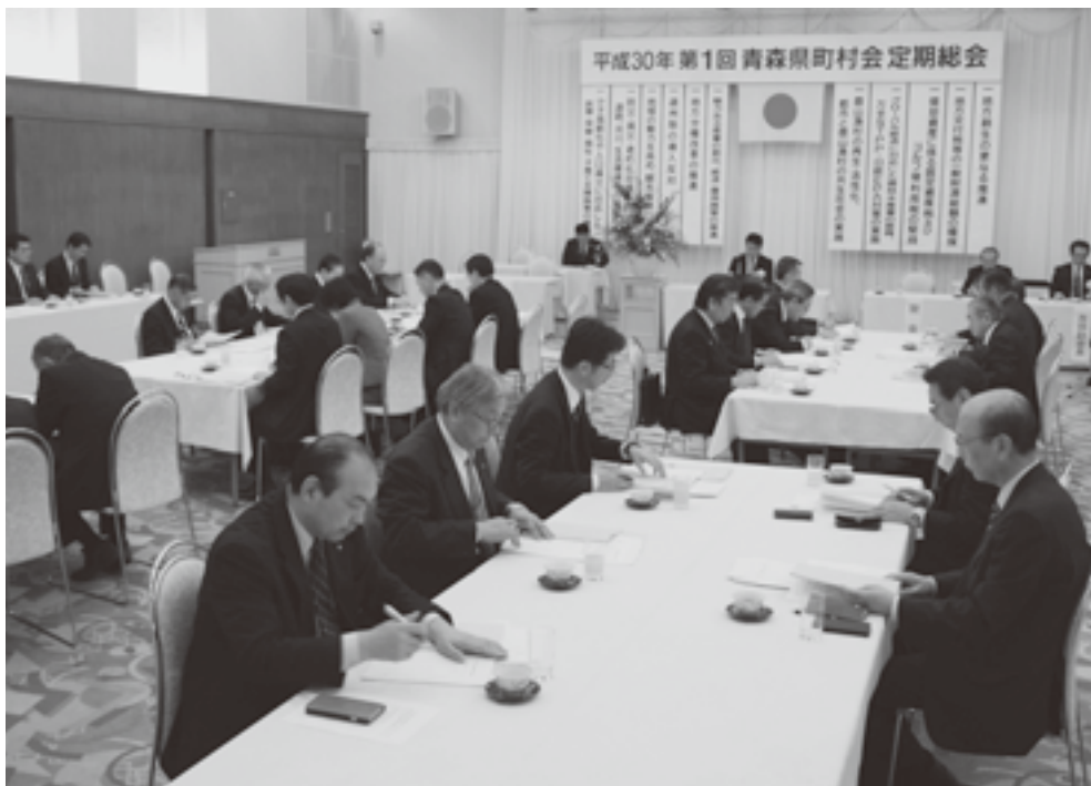
定期総会には町村長はじめ42人が出席