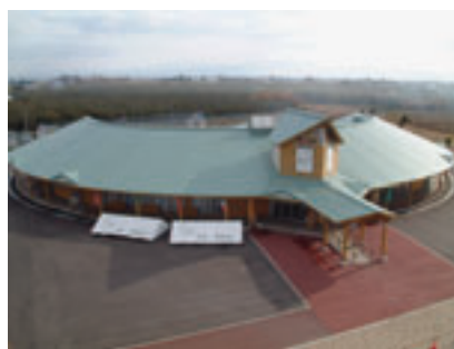
道の駅つるた「鶴の里あるじゃ」

村が出資した第三セクターで運営しておりますが、営業開始以来、営業赤字を出していない優良企業であり、雇用の確保や農家所得の向上、町のイメージアップに大いに貢献してきました。