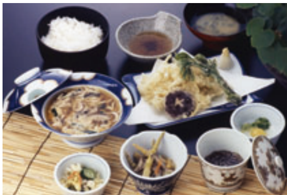
問い合わせ先 外ヶ浜町役場 産業観光課 TEL 0174-31-1228 かにた川 TEL 0174-22-2375(期間のみ)

外ヶ浜町蟹田地区では、毎年4月下旬から5月にかけてシロウオ漁が最盛期になり、蟹田川沿いでは漁を間近に見ることができます。また、この時期限定でシロウオ料理を堪能できる食堂が開設し、シロウオの踊り食いや卵とじ、同時期に獲れるトゲクリガニを求め多くの観光客で賑わいます。