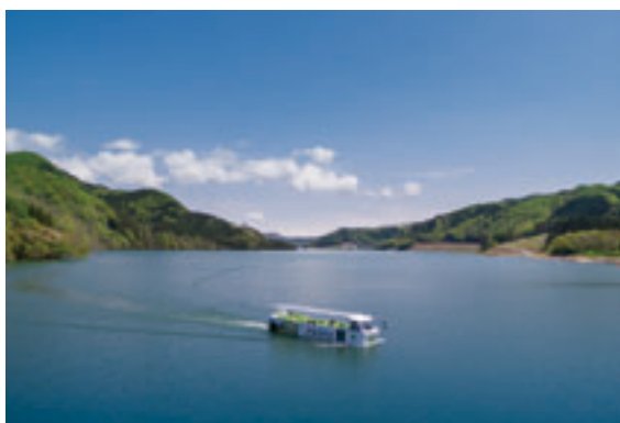
問い合わせ先 津軽白神ツアー TEL 0172-85-3315

今年も水陸両用バス「津軽白神号」の運行が4月28日(土)から始まります。予約受付は新しく整備された道の駅「津軽白神」の津軽インフォメーションセンター内津軽白神ツアーまでお気軽にご連絡ください。是非、水陸両用バスに乗ってダム湖を遊覧してみませんか?