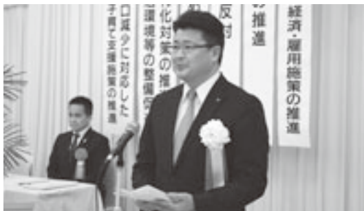
関会長が町村財政基盤の充実強化等を訴える

本会は二月二十二日、青森市のラ・プラス青い森で定期総会を開催し、平成三十年度事業計画及び予算などを決定したほか、地方創生の推進など十一項目の決議を採択した。また、議事に先立ち、全国町村会表彰の伝達及び青森県町村会表彰として自治功労者の表彰を行った。