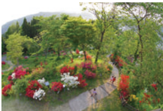
問い合わせ先 大鰐町役場 企画観光課 TEL 0172-48-2111

色鮮やかなつつじが咲き誇る茶白山公園では、毎年5月下旬頃に大鰐温泉つつじまつりが開催されます。昭和41年から毎年植樹が続けられ、「紅きりしま」や「日の出きりしま」、「久留米つつじ」、「藤ぼたん」など40数種、総数1万5千本以上を数えるつつじの名所となっています。