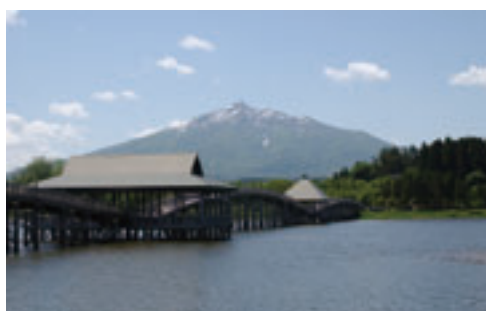
岩木山と鶴の舞橋

れるものと確信しております。また、施設内には観光案内所を設置し、鶴の舞橋を中心とした観光情報の発信を加速させる予定となっております。四月にオープンしますので、リニューアルした道の駅で皆様のお越しをお待ちしております。