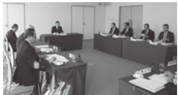
平成30年度予算などを審議

同意を求めるの件Ⅱ議員のうちから選任した監査委員の任期が平成二十九年十一月三十日で満了となったことから、新たに山田大鰐町長を選任した。