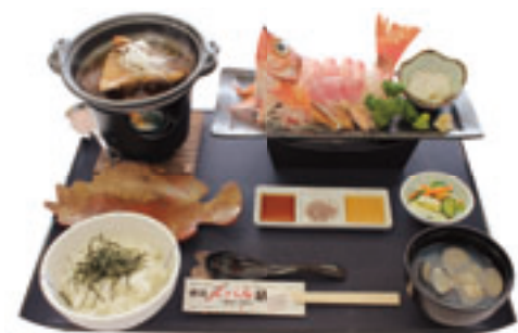
これが「中泊メバルの刺身と煮付け膳」です!!

け（ファイヤーグルメ）のほか、イカ漁が盛んなことからイカ刺しご飯や地場産の魚介類を使った海鮮汁が付いたご当地グルメです。二〇一五年七月の発売から瞬く間に人気を集め、わずか二年で四万食以上を売り上げ、青森県内ご当地グルメの代表格となりました。