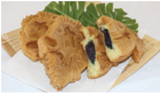
中里高校生のアイデアで誕生した「メバ焼き！」

地域の課題をビジネスの手法で解決しようという取り組みを行っている青森県立中里高校SBP（ソーシャルビジネスプロジェクト）同好会の生徒が「メバルによる町おこし」のお手伝いをしたいと考え開発、メバル料理推進協議会が協力し完成しました。津軽海峡メバルをかたどったオリジナルの焼き型を使い、つぶ餡のほか町の特産を活かしたブルーベリー餡、トマト餡の三種の味が楽しめます。