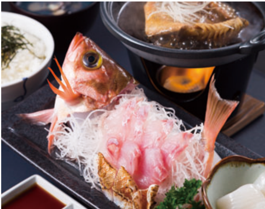
デビューからわずか2年で4万食を達成した「中泊メバル膳」

全国でも津軽半島沿岸地域が主な漁獲地となっている高級魚のウスメバル。中泊町は青森県漁獲量の約半数を占め、青森県ナンバーワン！の水揚げを誇ります。他の地域であまり水揚げされないウスメバルを使った、中泊町ならではの当地グルメを紹介します。