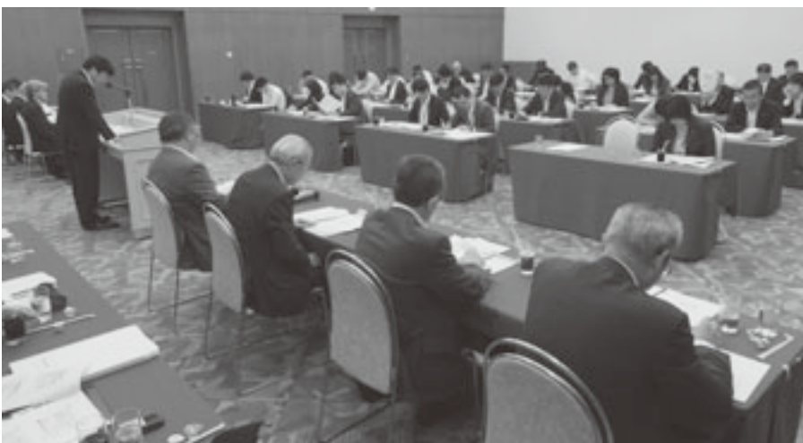
地域再生計画の共同策定について説明