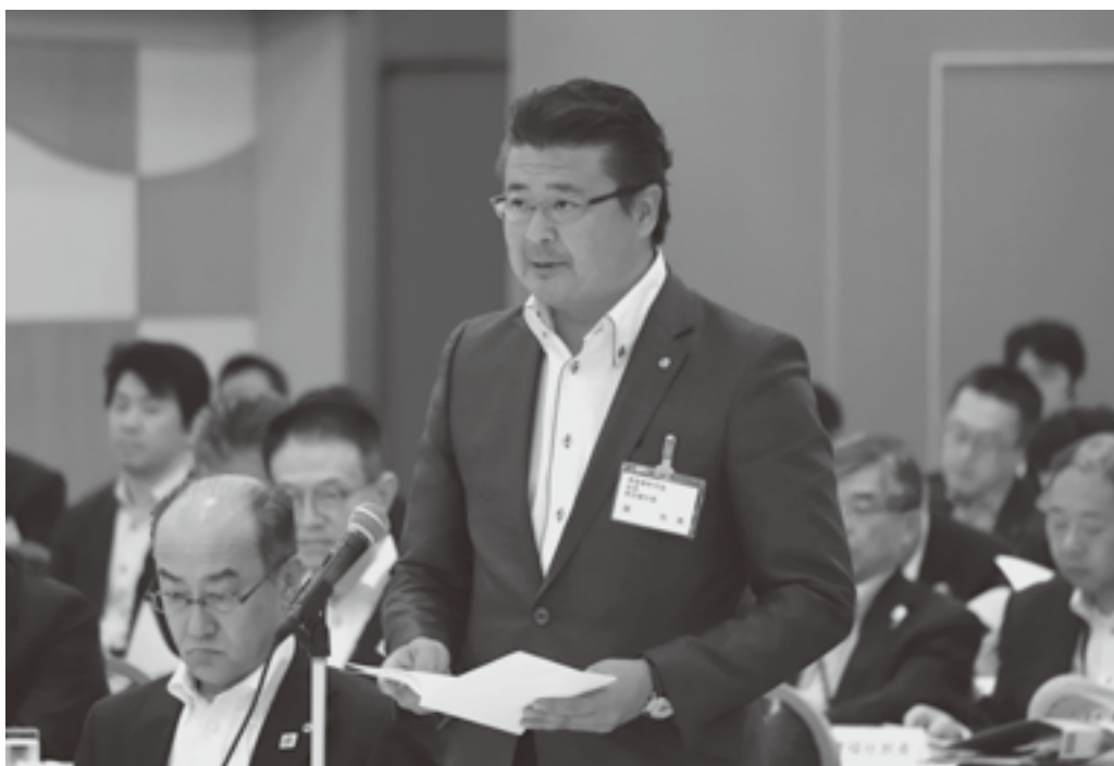
関会長が地方創生の推進、地方財政基盤の充実・強化を訴える