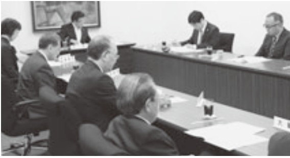
事業計画等を審議した青森県広報広聴協議会理事会