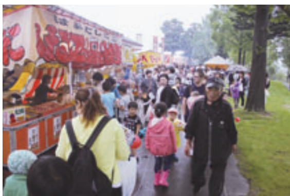
問い合わせ先 しちのへ夏まつり実行委員会(商工観光課内) TEL 0176-62-2137

キャラクターショーや有名ゲスト歌謡ショー、誰でも参加可能なチャレンジコーナーもある大人から子どもまで楽しめるイベントです。夜には花火大会も開催されますので、皆さまお誘い合わせの上、ご来場ください。