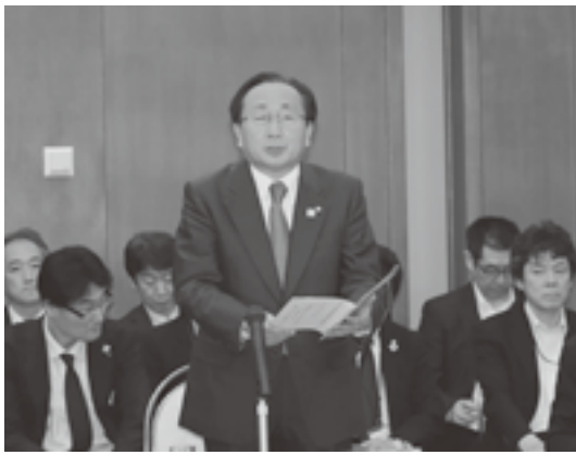
三村知事が県と町村とのより一層の連携を呼びかける

(1) 防災・減災・老朽化対策について 東日本大震災以降も人命を脅かす災害は全国