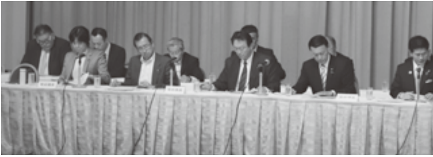
県選出国會議員 5 名が出席