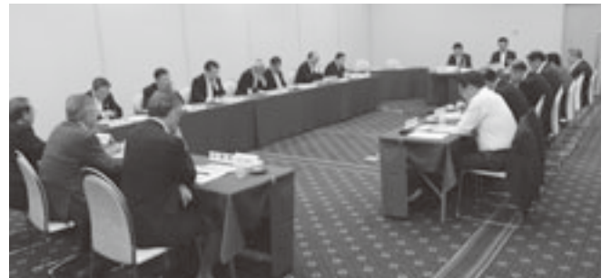
産業経済委員会で農林水産部が主要施策を説明

「県農林水産部の平成30年度主要施策」と題し、高品質な県産品づくりと販路開拓で経済を回す産業力の強化や、多様な担い手で農林漁村を支える地域力の強化等の説明があった。