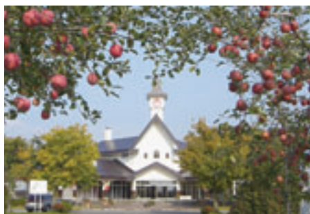
板柳町ふるさとセンター

その核となる施設が「板柳 町ふるさとセンター」で、学 んで、遊んで、泊まれる、様々 な施設からなっており、ここ に来ればりんごのすべてがわ かる、まさに施設全体がりん ごの博物館といえる場所と なっています。