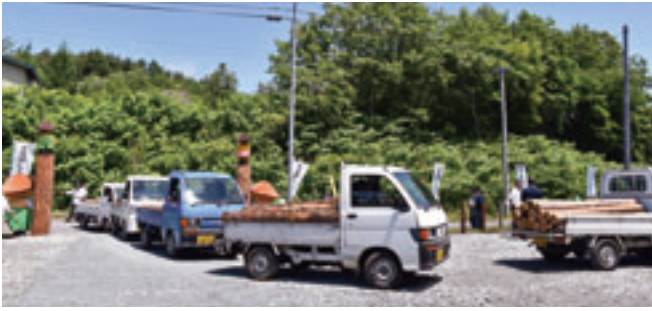
木の駅から木材を出荷する軽トラック

さらに、木材の買取りを村内の提携商店で使用可能な地域通貨「郷やま券」で支払うことで、村内の商店の活性化