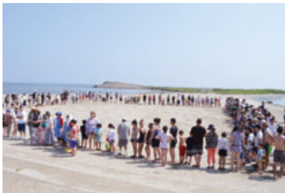
問い合わせ先 蓬田村観光協会 TEL 0174-27-2450

「玉松海まつり」は毎年8月第一日曜日に玉松海水浴場で開催されます。宝探しゲームやトマトジュース早飲み大会など、参加型の楽しい企画が盛りだくさんのイベントです。新鮮なホタテの貝焼きの振る舞いや、豪華賞品のプレゼントなどもあり、多くの参加者で賑わいます。