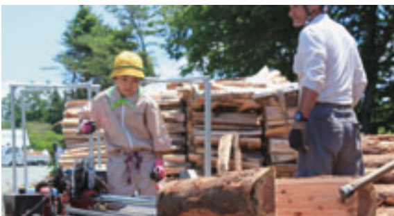
薪割りを体験する緑の少年団員

*新郷村木の駅プロジェクトに関するお問合せは、新郷村役場産業建設課産業グループまでお願いします。【0178(78)2111】