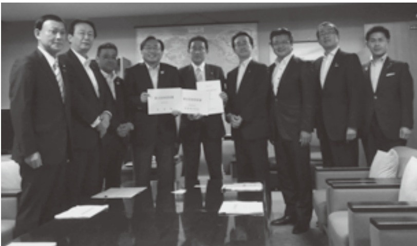
岸田自由民主党政調会長へ提案書を提出

本会は、県、市長会の三団体合同により六月十八日、東京都内で、自由民主党をはじめ、内閣官房、総務省、財務省、厚生労働省、農林水産省、国土交通省、環境省に対し、平成三十一年度の重点施策提案を行った。