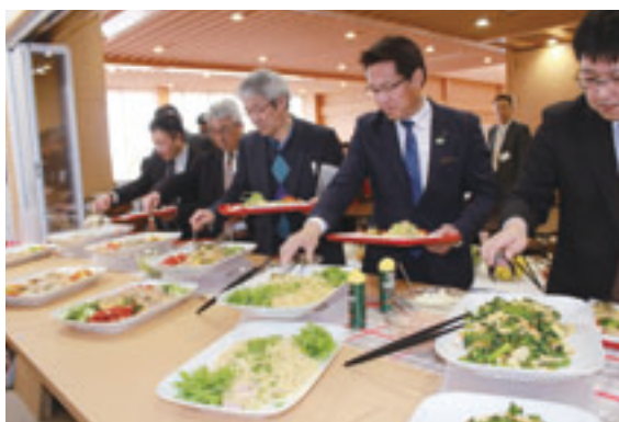
問い合わせ先 ふじさき食彩テラス事務局 TEL 0172-26-6901

国道7号沿いの「食彩ときわ館」が「ふじさき食彩テラス」としてリニューアルオープンしました。