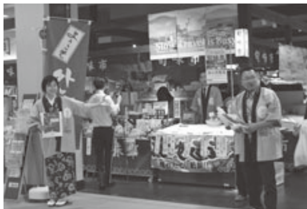
着物姿で店頭立つ山崎外ヶ浜町長（左）

初日には、山崎町長が着物姿で店頭に立ち、観光客に特産品の説明やパンフレットを手渡し、町のPRを行いました。