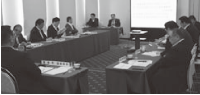
総務厚生委員会で健康福祉部が主要施策を説明