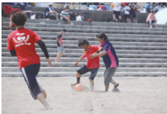
問い合わせ先 小泊観光協会 TEL 0173-64-3700 (代)

今年も「中泊町ビーチサッカー青森県大会inこどもり」が、折腰内ビーチで開催されます。太陽に照らされ、熱くなった砂浜の上で、選手たちの激闘が繰り広げられます。