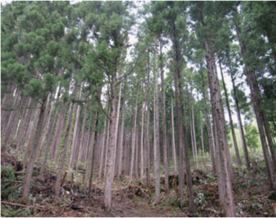
新郷村の豊かな森林

面積の七十五パーセントを森林が占めている新郷村では、森林整備と地域の活性化を目的とした取組を行います。その名も「木の駅プロジェクト」。人と自然との関わり方について改めて考えるこの取組について紹介します。