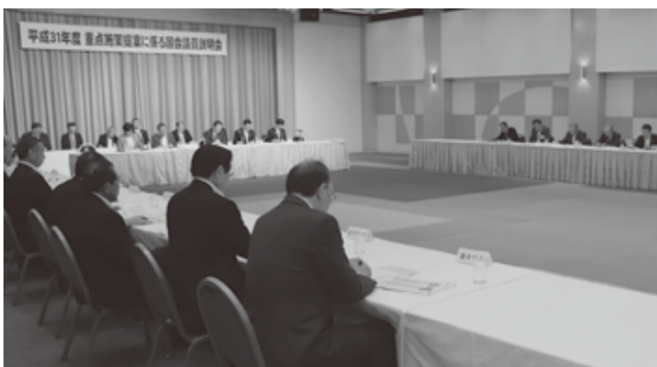
説明会には約130名が出席

説明会では、三村知事が『青森県基本計画未来を変える挑戦』は最終年度を迎えたが、これまでの取組成果が各分野において着実に現れている。今年度は計画の総仕上げと次のステージへのステップアップのため