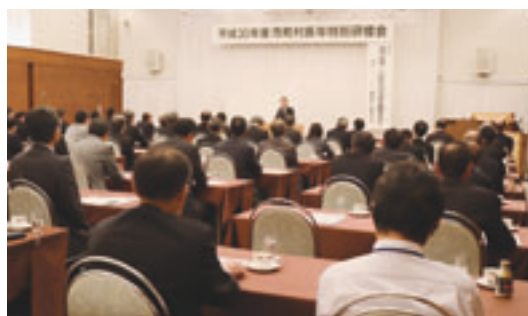
研修会には78名が出席

研修会では、関会長の挨拶の後、ジャーナリストの長谷川幸洋氏が「政治・経済（これからの日本を展望する）」と題し、講演を行った。長谷川氏は、第四次安倍改造内閣の発足や自民党役員人事、また諸外国との関わりや