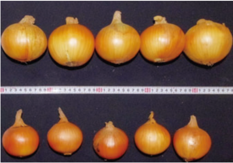
残さ堆肥の効果が一目瞭然（上が堆肥使用、下が不使用） ※弘前大学の成果報告書より

布され土壤改良材として利用されるなど、地域循環型の処理方法の構築は、農漁業双方にメリットがあり、農業振興や地域経済の活性化も期待されています。