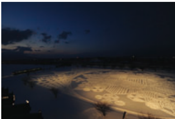
問い合わせ先 田舎館村役場 企画観光課 TEL 0172-58-2111