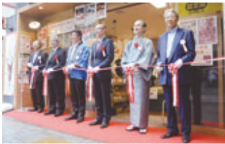
関会長（左から3人目）ら関係者がテープカット

九月二十九日のオープニングセレモニーでは、関会長及び貝守青森県東京事務所長のあいさつの後、来賓と主催者によるテープカットが行われ