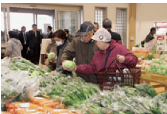
問い合わせ先 一般社団法人 六ヶ所村観光協会 TEL 0175-71-3115

村の農畜産物や加工品などの特産品販売所“六ヶ所館（ろくしゅんかん）”が開館しました。新鮮な農海産物や加工品などを中心とした特産品販売コーナーや手打ちそばの見学、地元の特産品を使用した料理を堪能できる軽食コーナー、赤ちゃんやお子様を連れたご家族にうれしい多目的休憩所やキッズ・授乳コーナーが完備されています。皆さんお誘い合わせの上、ぜひご来館ください。