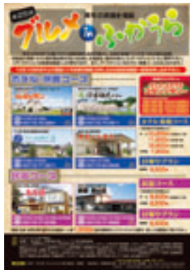
問い合わせ先 一般社団法人 深浦町観光協会 TEL 0173-74-3320

真冬の日本海で水揚げされた鮮度抜群の食材の数々と地酒を堪能できるイベント。特産品や旅館・ホテルの無料宿泊券が当たるお楽しみ抽選会や趣向を凝らしたアトラクションもご期待下さい。