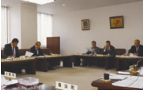
45団体の次年度負担金を審査

平成三十一年度の法令外負担金規制団体は四十五団体（対前年度比 増減なし）で、総額八千八百六十七万九千七百八十円の回答があり、審議の結果、平成三十一年度の負