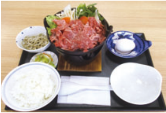
問い合わせ先 道の駅いまべつ半島ぶらざアスクル TEL 0174-31-5200

道の駅いまべつ半島ぶらざアスクルでは、期間限定（3月31日まで）で鍋メニューが提供されています。