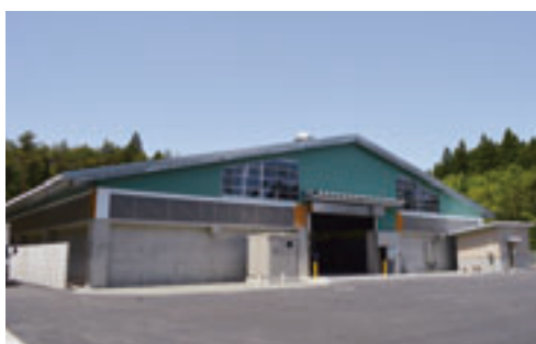
残さ堆肥化処理施設

の産地水産強化支援事業施設整備支援事業により整備を進め、平成二十七年六月一日に稼働しました。本施設は、ホタテガイ残さと副資材の鶏ふ