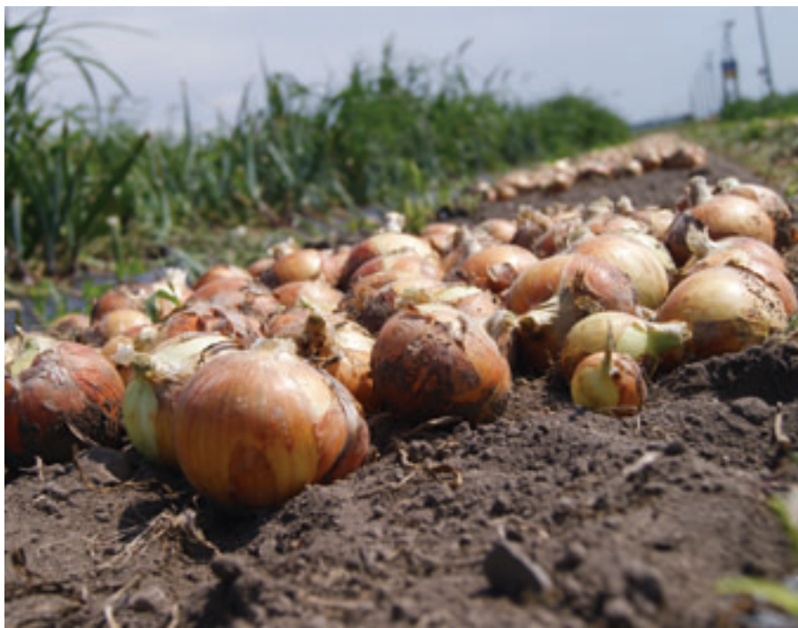
ホタテガイ残さ堆肥を活用し、玉ねぎのブランド化を目指す

本施設で製造された堆肥の原料は、すべて村の未利用の資源で賄われています。残さを利用した堆肥化は県内自治体では初めての試みで、他自治体も注目する施設となりました。村内に施設が建設されたことで、漁業者の労力や費用の大幅な軽減に加え、出来上がった堆肥は農家に無償配