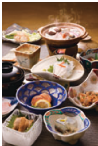
風間浦鮫鱈フルコース膳

化が著しい二つの大衆浴場を統合し、新浴舎の整備を進めており、東京オリンピックの開会式に合わせた二〇二〇年の開業を目指しています。県内有数の水揚げを誇る風間浦鮫鱈は、今がまさに旬です。鮫鱈は捨てる場所は骨だけといわれる食材ですが、そのほとんどが生きたまま水揚げされる新鮮な風間浦鮫鱈は、お刺身も美味です。冬の下風呂温泉と風間浦鮫鱈をお楽しみいただければと思います。たくさんのお越しをお待ちしております。