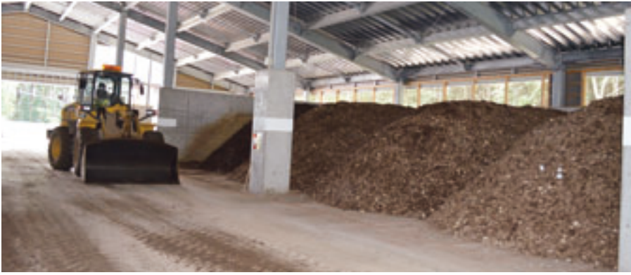
残さ堆肥化処理施設で良質な堆肥を製造