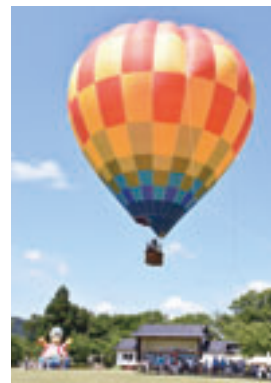
問い合わせ先 三戸町役場 まちづくり推進課 TEL 0179-20-1117

130周年を記念して記念式典のほか、さまざまなイベントを企画しています。7月31日（水）には、『夏期巡回ラジオ体操&熱気球搭乗体験』を関根ふれあい公園で実施。みんなで元気にラジオ体操!体操の後は、熱気球に乗って大空へ!!