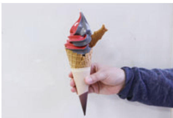
問い合わせ先 深浦マグロ料理推進協議会事務局(深浦町観光課内) TEL 0173-74-4412

新・ご当地グルメ「深浦マグロステーキ丼」の姉妹商品として、水揚げ量本県一を誇る深浦マグロを使った「深浦マグロソフトクリーム」が誕生し、同町役場内「役場マグステ食堂」で販売しています。マグロ赤身の鮮やかな赤、魚体の銀それぞれの色合いを再現し、「インスタ映え」間違いなし!マグロの「だし粉」をわずかに使用していますが、果たしてどんな味なのでしょう。税込み350円で販売は11月30日まで。