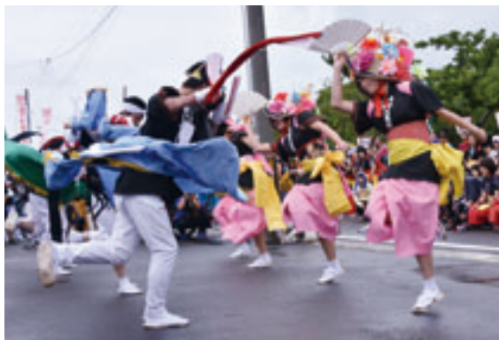
問い合わせ先 今別町観光協会 TEL 0174-35-2014

今別町では8月3日(土)～8月7日(水)にかけて、「荒馬まつり」が開催されます。勇壮な馬役の男性と可憐な手綱役の女性が一对で舞い踊り、町を練り歩く魅力あるまつりです。4日の合同運行では、地元特産品の販売やステージイベントなど企画を数多く用意しておりますので、ぜひお越し下さい。