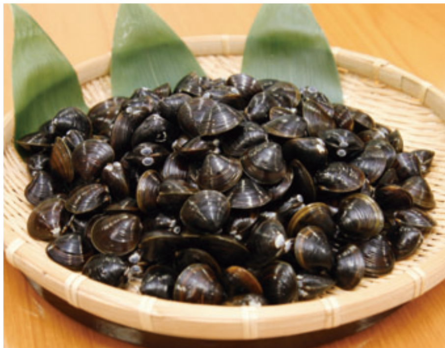
地理的表示（GI）登録を受けた「小川原湖産大和しじみ」

東北町が有する小川原湖で水揚げされる大和しじみ。徹底した資源管理によって「地理的表示（GI）」に登録されたことを受け、東北町ではこれまで以上にPR活動に力を入れていきます。