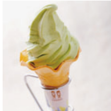
問い合わせ先 菜の花プラザ TEL 0175-78-6687

販売時間：9：00～16：45（水曜日は9：00～16：00、木曜日は9：30～16：45）