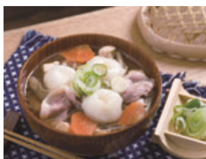
おいらせだるま芋へっちょこ汁

であるという意識を持つことが大切です。農業は、町の大切な基幹産業の一つです。農業が増えれば、農産物の流通や雇用などに関わる多くの産業に活気を与えてくれます。近年の農業者数は減少していますが、経営の意識をもった意欲的な農業後継者が育っていることを心強く思います。「農業は生命を生み出す素晴らしい仕事」だと後継者や若者が思うためにも、先輩の農業者達が自信とやりがいをもって農業経営に携わってほしいと考えます。また、行政も「人」が賑わう政策を展開しなくてはなりません。