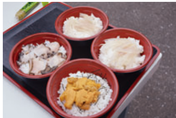
問い合わせ先 ゆかい村海鮮どんぶりまつり実行委員会 （風間浦村商工会内） TEL 0175-35-2010