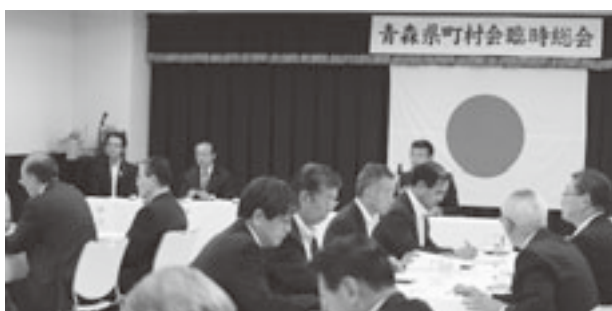
新たな執行体制を決定した臨時総会