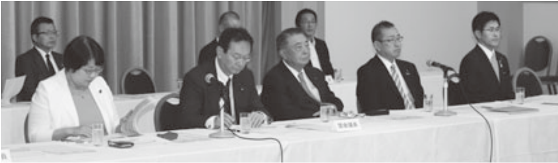
県選出国会議員5人が出席

医療の確保・充実等も重要課題であるため、特段のご配慮をお願いしたい。」とあいさつを述べ、引き続き本会事務