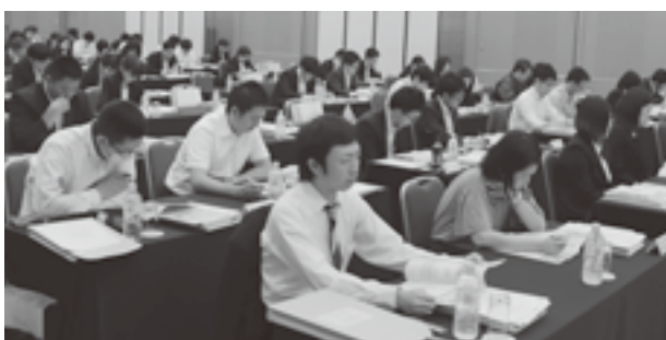
共済事業について説明を受ける出席者