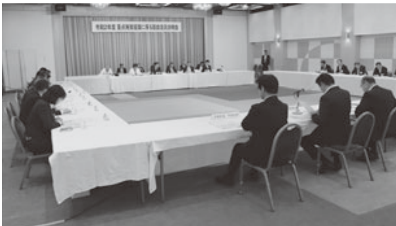
説明会には約140人が出席

説明会では、三村知事が主催者を代表し「今年度から、新しい青森県基本計画である『選ばれる青森への挑戦』がスタートした。引き続き人口減少克服を最重要課題として、これまで以上に攻めの姿勢で様々な取組を行い、着実に成果を上げていきたい。」とあいさつを述べた後、