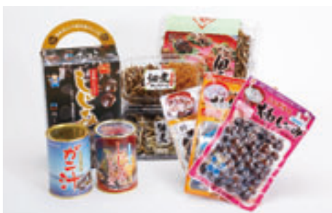
道の駅おがわら湖で販売される水産加工品

小川原湖のすぐそばにある道の駅「おがわら湖」では、大和しじみなどの水産物や水産加工品を購入できるほ