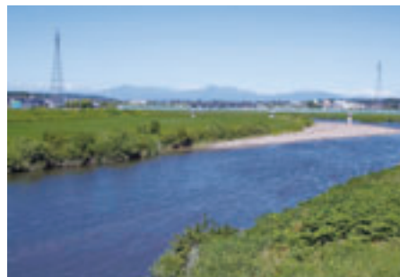
町を流れる奥入瀬川

私は、子どもの頃から父親の姿を見ながら、農業を営んできました。今は、なかなか時間を取れずにいますが、それでも水田の管理や家畜の世話をしています。天候や価格の影響を受けやすく、自分の思い通りにいかないことも多い農業ですが、生きるために必要な食糧をつくりあげ、それを食べて私たちは生きています。この「生命を生み出す素晴らしい仕事」に大きなやりがいと魅力を感じています。