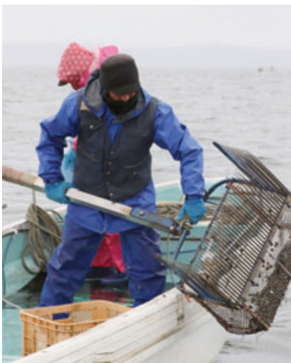
しよれん 鋤簾を使って湖底からしじみをすくい上げる

か、ファーマーレストラン「ポロトピア」で、小川原湖産大和しじみを使った料理を食べることが出来ます。平日は一日五食、週末は一日十食限定の「特撰しじみラーメン」は通常のしじみラーメンに比べて大粒のしじみを使用しているため、しじみのうまみをより強く味わうことができます。ほかにも東北町名物の「じゃがいも入りしじみ汁」や、「しじみソフト」などもここで味わうことができます。 ※「小川原湖産大和しじみ」に関するお問い合わせは東北町役場農林水産課【0176(56)3111】までお願いします。