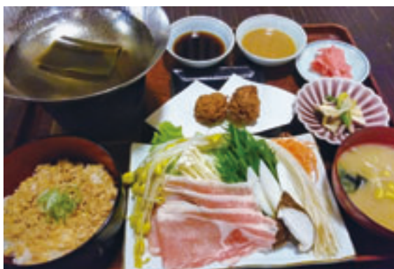
問い合わせ先 大鰐町地域交流センター 鯉come内 お食事処「花りんご」 TEL 0172-49-1126

伝承400年。幻の野菜「大鰐温泉もやし」をふんだんに使用したしゃぶしゃぶ鍋セット。