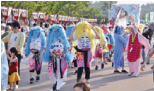
祭りを盛り上げた「化人」

等は基本的に地元公民館に寝泊まりしていますが、地域住民宅でお風呂に入り酒を酌み交わしそのまま宿泊する等、学生・地元住民が一体となつて非常に濃密な人的交流が行われています。