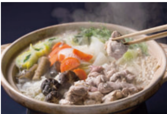
問い合わせ先 六戸ブランド研究会(六戸町観光協会) TEL 0176-55-4495

「青森シャモロック ザ・プレミアム #6」は、地鶏本来の味を追求するために、選抜したオスを通常期間からさらに30日間延長飼育し、ガーリック粉末を加え旨味成分を高める特別飼料を給与しました。 弾むような肉を噛みしめれば、ジューシーかつパワフルな旨味が口いっぱいに広がります。また、お出汁は、濃厚なのに雑味のないすっきりした味わいです。