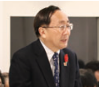
三村知事が県と町村とのより一層の連携を呼びかける

インフラの長寿命化の事業の実施にあたっては、地方財政措置として公共施設等適正管理推進事業債が設けられており、今年度から道路橋りよの改修事業も対象事業に追加されるなど、順次制度の拡充が図られているため、町村においても積極的なご活用をお願いしたい。