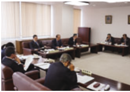
44団体の次年度負担金を審査

令和二年度の法令外負担金規制団体は四十四団体（対前年度比 一団体減）で、総額九千四十七万七千四百四十円の回答があり、審議の結果、令和二年度の負担金額は、各団体