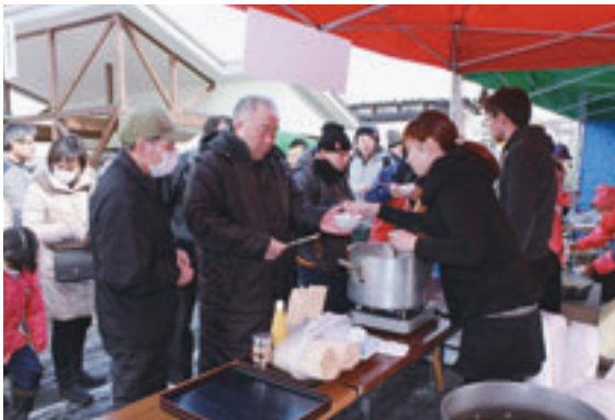
問い合わせ先 藤崎町商工会 TEL 0172-75-2370

令和2年2月23日（日）、藤崎駅前通りにて「なべワングランプリ ふんちゃぎ楽戦」を開催します。 藤崎町内の各団体が、それぞれに趣向を凝らしたオリジナルの鍋料理を販売し、割りばし投票でグランプリを決定します。寒い季節にぴったりの温かい鍋料理を堪能できます。たくさんのご来場お待ちしております。