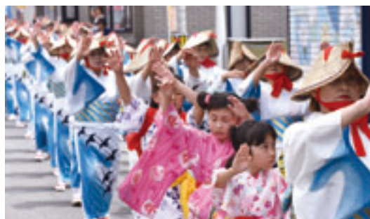
「今別おけさ」も祭りを盛り上げる

等は基本的に地元公民館に寝泊まりしていますが、地域住民宅でお風呂に入り酒を酌み交わしそのまま宿泊する等、学生・地元住民が一体となつて非常に濃密な人的交流が行われています。