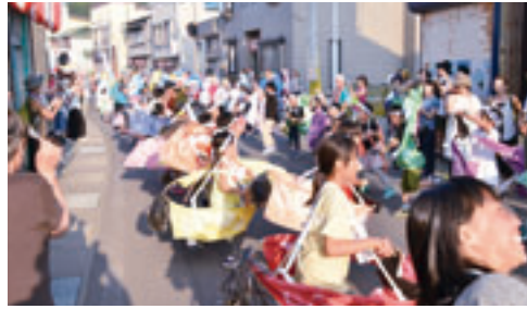
民族舞踊の授業の一環として毎年参加している和光小学校、和光鶴川小学校の児童

馬を通して形成されています。児童や学生等との関わりの中で、地域住民間で荒馬の継承のあり方や受入態勢強化等についての話し合いが進み、荒馬に対する誇りや郷土愛の醸成に繋がっています。