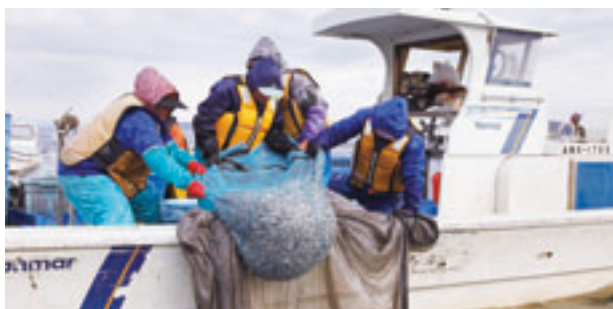
小川原湖のワカサギ・シラウオ漁

一年を通して漁ができる大和シジミをはじめ、日本有数の漁獲量を誇るワカサギ、シラウオや希少価値が高い天然のウナギ、名物ガニ汁で有名なモクスガニ等が主要な産物です。