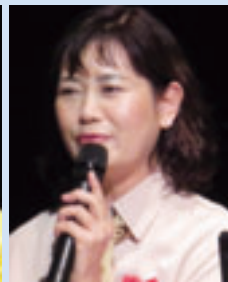
株式会社紡玉冲氏