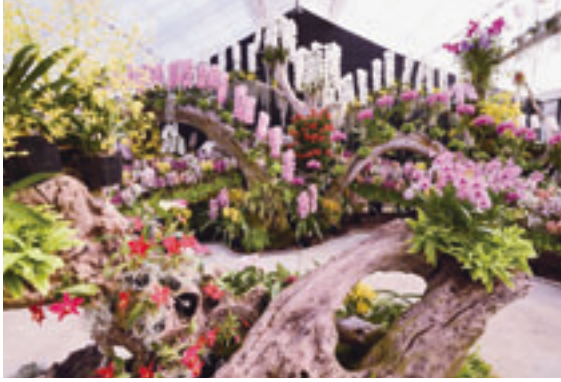
問い合わせ先 夜越山森林公園 TEL 017-755-2663

南国の香りに包まれた洋ラン温室には約150種、2,000鉢もの洋ランと大型ディスプレイを展示するほか、青森蘭友会による展示会や通常の20~30% OFFの洋ラン即売会、専門家による洋ランなんでも相談室を開催します。 ○日時：3月1日（日）～22日（日） 8：30～16：30 ○場所：夜越山森林公園 ○入園料：大人500円、小人150円