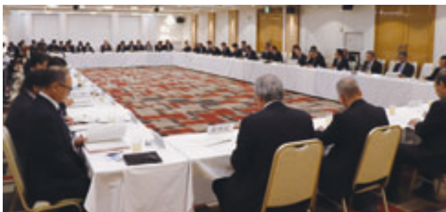
町村長と県が本会提言について意見交換

（2）担い手の育成・確保及び新規就農者・施設整備等への支援の強化について 県では本年九月、県議会とともに国に対して「農業次世代人材投資事業」の継続と十分な予算の確保について要望を行ったところ、その後、国からの追加配分があった。また、国からは不足分についても要件等確認のうえ、今後、追加配分すると聞いている。