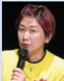
有限会社はたやま夢楽小松氏