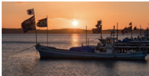
夕日に映える小川原湖（舟ヶ沢地区）

小川原湖は、わが町の北東部に位置し、全国の湖沼では、十一番目の面積を誇り、「東北町大字大浦字小川原湖一九一番地」という住所を有している湖です。