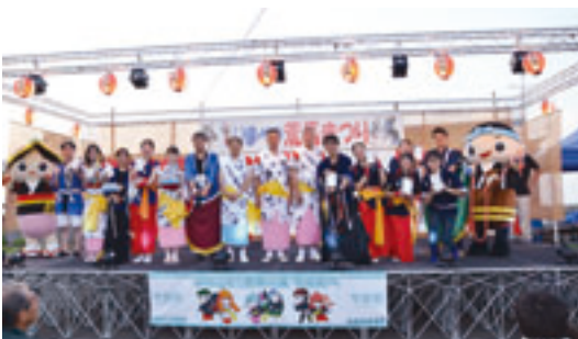
第3回「世界荒馬選手権」入賞者

今別町は、今後も伝統芸能である荒馬の保存・伝承活動を支援するとともに、荒馬まつりの来訪者が年々増加し、交流人口が拡大していることから、関係機関と連携したPRだけでなく、関係人口や移住者の受入体制の整備に力を入れて取り組んでいきます。※「今別町荒馬まつり」に関するお問い合わせは今別町観光協会（0174（35）2014）までお願いします。