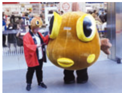
階上町の「あぶらめくん」が町をPR