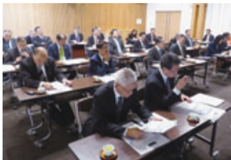
梶原町の取り組みの説明を受ける町村長

JICA愛媛たいきが整備した「愛たい菜」は大洲特産の新鮮野菜が主力商品である。大洲市では平成二十四年より学校給食の地産地消を進めており、地産地消率は平成二十四年度の十八・一％から平成二十四年度は六十二・一％と大きく伸びている。また、食材の利用者との情報交換を密に行い、出荷者には学校給食への食材供給の意義と必要性を伝え、安定供給体制の構築を図っている。