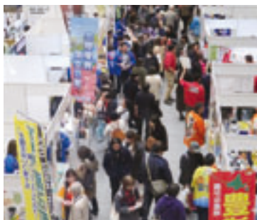
賑わう展示・販売コーナー

今回は、全国九百二十六町村のうち、三百八十町村(本県十町村含む)が参加し、二日間で過去最高の五万三千人の来場者があった。展示・販売コーナーには全国各地の特産品が出品されたほか、「町イチ! 村イチ! 食堂」での郷土料理の販売や、ご当地キャラクターの出演、郷土芸能・パフォーマンズの披露など、それぞれの出展町村が「イチ押し」を披露した。