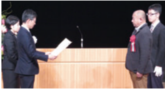
プロジェクトおおわに事業協同組合が総務大臣賞を受賞

その後、優良事例表彰式が行われ、総務大臣賞の「プロジェクトおおわに事業協同組合」をはじめ、九事例が表彰