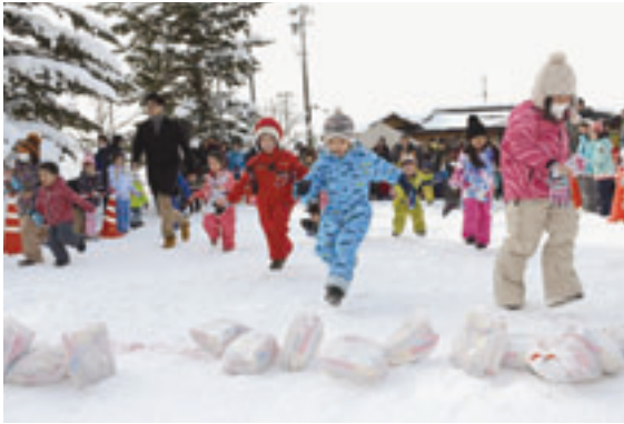
問い合わせ先 板柳町役場産業振興課 地域振興係 TEL 0172-73-2111 (内線320)

2月11日（火・祝）に板柳町ふるさとセンターで「第33回りんごの里いたやなぎ雪まつり」を開催します。 みかんまきや餅つき、豪華賞品が当たる大抽選会など、イベントが盛りだくさん! ジャンボ滑り台や、巨大な「もつけ鍋」で作る豚汁の振る舞いもあります。家族みんなで楽しめるいたやなぎの雪まつり、ぜひお越しください。