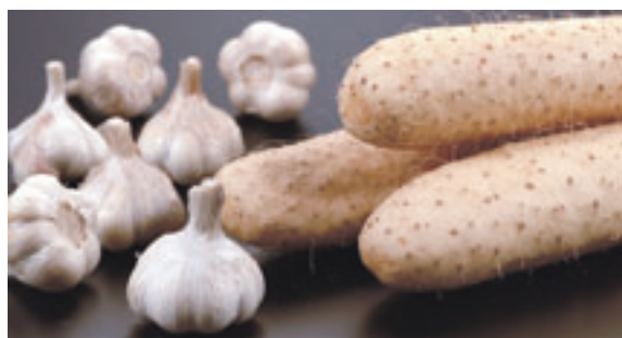
ニンニク・ナガイモ

道の駅おがわら湖では、小川原湖で獲れる豊富な魚介類をはじめ、農産物等が一年中店頭に並んでいますし、湖畔のわかさぎ公園等もきれいに整備され、春・夏・秋・冬の季節においていになっても、楽しむことができますので、たくさんの方々のお訪をお待ちしております。