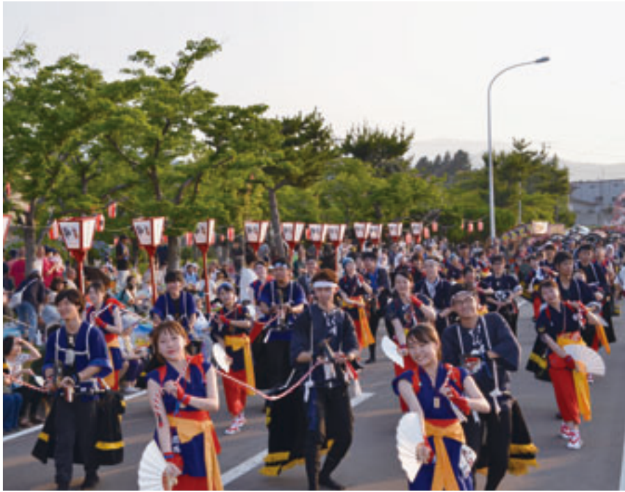
大川平荒馬には交流が続く立命館大学生等も参加