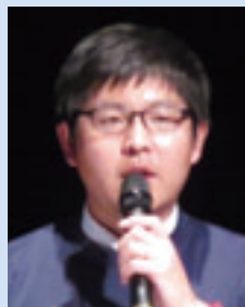
合同会社南部どき根市氏