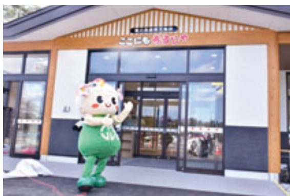
問い合わせ先 鶴の舞橋観光施設 ここにもあるじゃ TEL 0173-22-6211

鶴の舞橋に観光施設がオープンしました。お土産や鶴田町の特産品も多数揃えており、軽食やひんやりスイーツも楽しめるイートインスペースも完備しております。