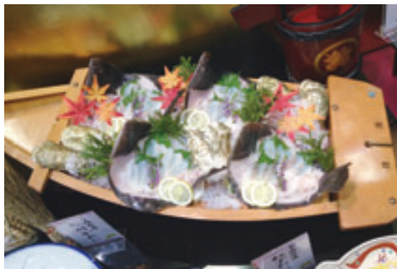
問い合わせ先 外ヶ浜町役場産業観光課 TEL 0174-31-1111

津軽半島の最北端龍飛岬では、幻の魚「マツカワガレイ」を青函トンネルからしみ出る海洋深層水を使って養殖しています。身が厚くプリッとした歯応えと、程良く乗った脂が上品な味わいの魚です。