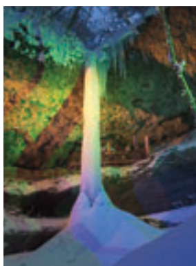
問い合わせ先 西目屋村産業課商工観光係 TEL 0172-85-2800

高さ33mの白絹のような乳穂ヶ滝。滝の裏の自然洞窟には、不動尊が祀られています。この滝は、冬に乳穂のように結氷することからこの名があり、結氷した滝は圧巻です。また、古来から正月の厳寒期にツララ状に結氷する滝の太さや形状などで、津軽地方の作況占いがされてきました。