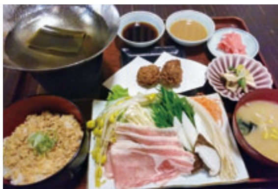
問い合わせ先 大鰐町地域交流センター「鰐come」内 お食事処 花りんご TEL 0172-49-1126

約400年前から、温泉熱・温泉水のみを用いて栽培されている伝統の冬野菜「大鰐温泉もやし」を、特徴であるそのままの長さで食べることで、素材本来の旨みとシャキシャキ感を十分に堪能・体感することができます。