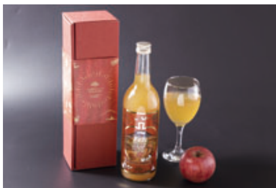
問い合わせ先 ふじさき食彩テラス TEL 0172-65-3660