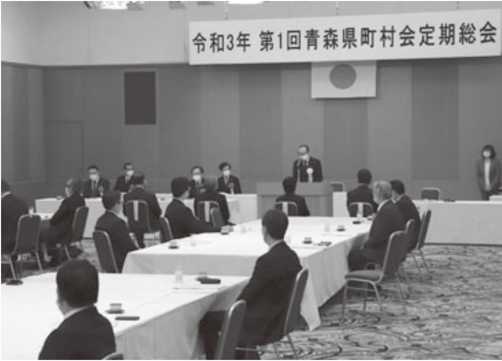
定期総会には町村長はじめ40人が出席

本会は二月二十六日、青森市のアップルパレス青森で令和三年第一回定期総会を開催し、令和三年度の事業計画及び予算などを決定したほか、新型コロナウイルス感染症の拡大防止と万全な地域経済対策の実施など十項目の決議を採択した。また、議事に先立ち、全国町村会表彰の伝達及び青森県町村会表彰として自治功労者の表彰を行った。