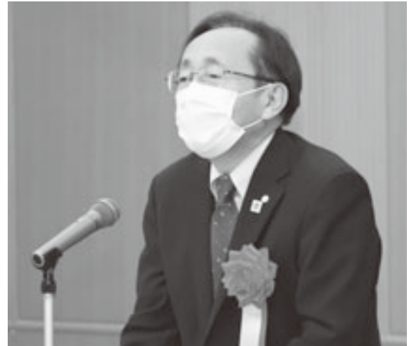
来賓祝辞を述べる三村知事

森県町村会事業計画案（概要） 「コロナ禍による影響や制約の中においても県、全国町村会及び関係団体と連携を緊密