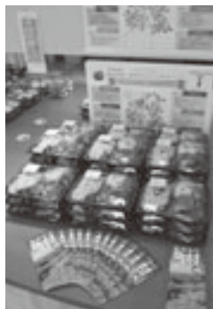
あおもり町村ガイド配布でPR