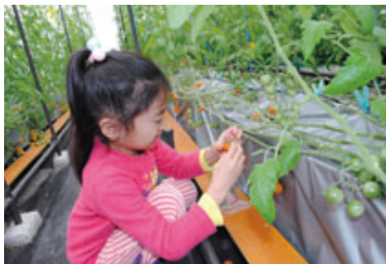
問い合わせ先 ふるさとセンター総合案内所 TEL 0172-72-1500

今年もミニトマトの収穫体験が始まりました。収穫できるのは赤や黄色、オレンジなど食味や色もさまざまな5品種。1人200円で約200グラムの収穫が可能です。実施は6月末まで(予定)。※生育状況や作業上、体験できない日もありますので、事前にお問い合わせください。