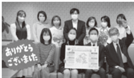
新菜葉、町村会スタッフ一同

本会としても、コロナ禍による影響や制約の中でも、引き続き、30町村を下支えするべく、様々な試みに積極的に取り組んで参りたいと思えます。