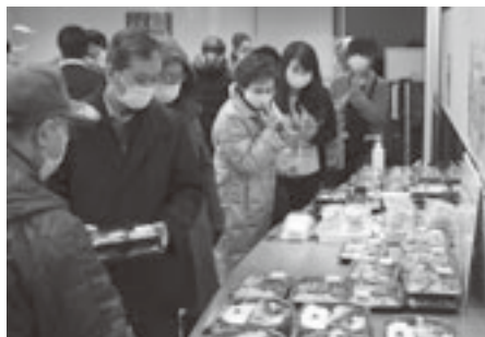
お弁当を買い求める多数のお客様

作成の「あおもり町村ガイド」での配布・PRや、本会ホームページでの毎日の情報発信、またお客様の口コミ効果等もあり、全日程即売御礼（全期間総販売個数約一千百個）により、大盛況のうちに六週間の開期を終えることができました。