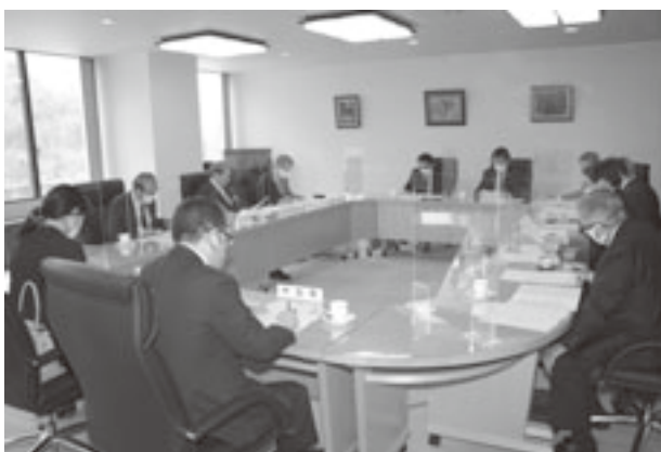
市町村長会議の提言事項を協議