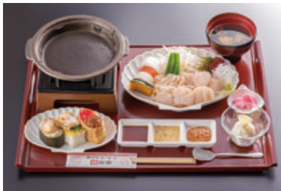
問い合わせ先 平内町役場水産商工観光課 TEL 017-755-2118

“食”がテーマの施設ひらないまるごとグルメ館「ホタテ一番」では、全メニューにホタテを使っているのはもちろん、お米は青森ブランド米を100%使用し、とことんこだわった創作料理が楽しめます。