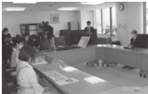
浜谷会長による試食会

郡の町村の厳選された旬の食材が盛りだくさんのお弁当を、各日30食限定、六百円で販売しました。