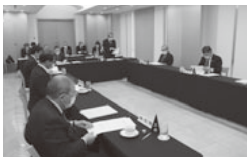
令和3年度予算などを審議