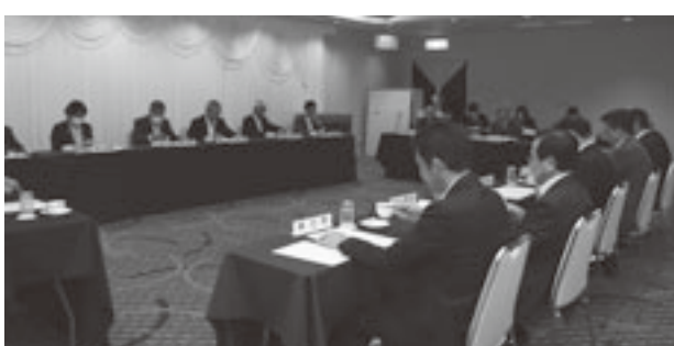
県主要施策の説明を受ける総務厚生委員会 (右)・産業経済委員会 (左)