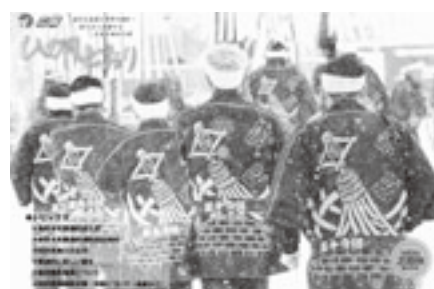
全国広報コンクール 一枚写真の部入選 「広報ひがしどおり」（令和4年2月1日号）

更するのは勇気がいりましたが、勇壮な消防団員の姿をぜひ村民の皆様に見ていただきたいと思いきや変更させていただきました。 今後は、今まで以上に村民の方にスポットを当て、村民が主役の広報紙づくりを目指して、取り組んでいきたいと思っております。