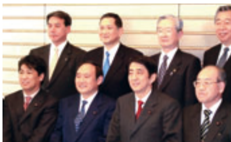
第一次安倍内閣で達者村事業について発表 当時の菅総務大臣も一緒

南部町は青森県の南東に位置し、町の南西部には標高615mの名久井岳を望み、中央部を流れる馬淵川流域には田園風景が広がる、豊かな自然に恵まれた美しい町です。南部藩発祥の地といわれ、南部氏が三戸城、九戸(福岡)城、盛岡城に移るまでの約350年にわたり、ここを拠点に南部地方を統治したとされています。