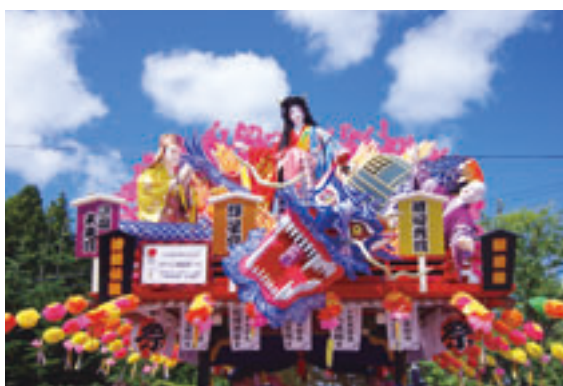
問い合わせ先 一般財団法人 野辺地町観光協会 TEL 0175-64-9555

「のへじ祇園まつり」は、8月17日~20日に行われる野辺地町最大のお祭りです。京都祇園まつりに似た優雅な囃子と山車は、南部藩有数の商港として栄えた時代に北前船に乗って移入されました。