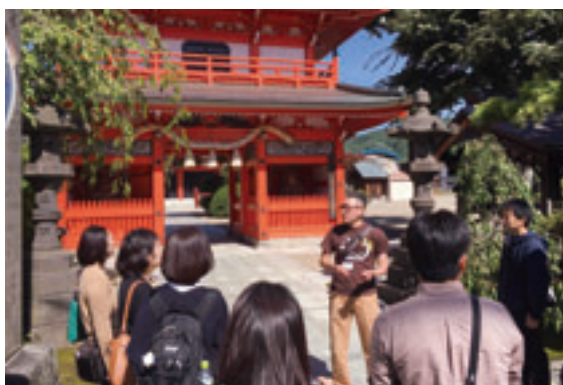
問い合わせ先 大鰐町地域交流センター「鰐come」 TEL 0172-49-1126

開湯800年以上もの歴史をもつ大鰐温泉。温泉が育んだ古くからの食文化や、だんご、せんべい店など、地域で愛され続けてきたなりわいが今も残る情緒漂う温泉街をゆったり散策しませんか?