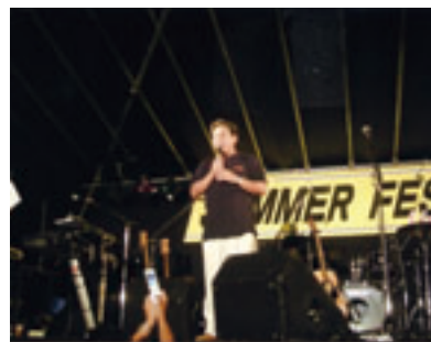
サマーフェスティバルで盛り上げる